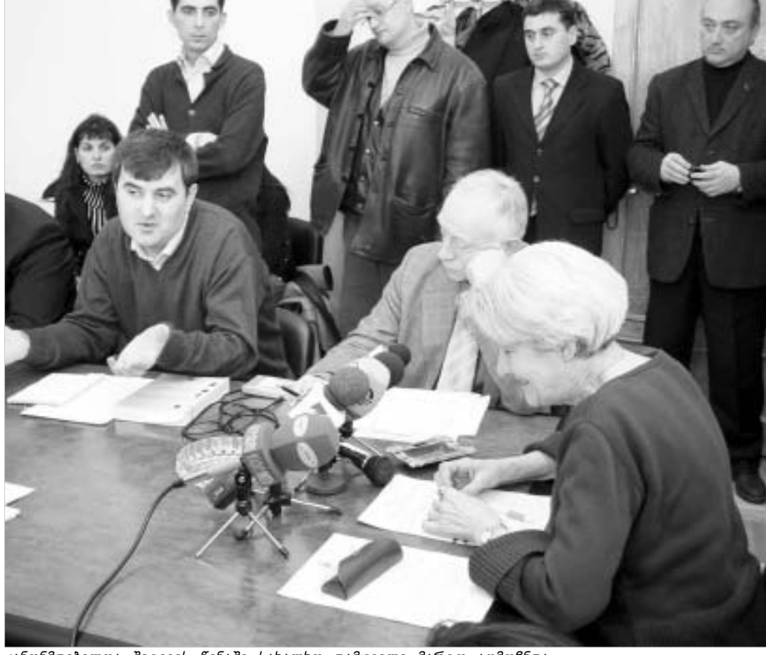
კანონმდებელთა შეტყვის წინაშე სახალხო დამცველი მარტო აღმოჩნდა.