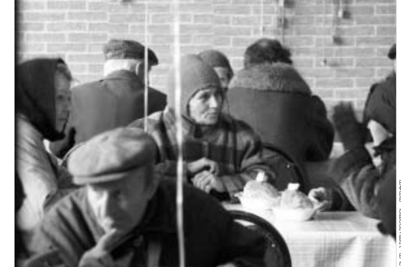
"საქართველოს ტელეკომის" საქველმოქმედო აქცია კათარზისში.

სათონის სახელ "კათარზისი" უფასო სასადილოს 2006 წლიდან საერთაშორისო სატელეკომუნიკაციო კომპანია "საქართველოს ტელეკომი" დააფინანსებს. ყოველდღიურად "კათარზისი" სრულყოფილი რაციონის ცხელი სადილი 355 ხანდაზმულებისთვის მომზადდება. კომპანია ამ პროექტით საქველმოქმედო საქმიანობის ახალი ეტაპს იწყებს.