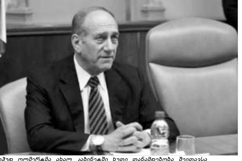
ეჟუდ ოლმერმა ახალი კაბინეტი ხუთი თანამდებობა შეითავსა

სული წლის მინურულს "ლიკუდი"-ში განხეთქილების შემდეგ პრემიერ-მინისტრმა არეულ შარონმა დააარსა. დღეისათვის ახალი პარტიის თავმჯდომარის მოვალეობასაც, შარონის ავადმყოფობის გამო, სწორედ ეჟუდ ოლმერტი ასრულებს. მოქმედი პრემიერის გადაწყვეტილებით, 28 მარტს დანიშნულ საპარლამენტო არჩევნებამდე საგარეო საქმეთა მინისტრის თანამდებობაზე სილვან შალოსი ყოფილი იუსტიციის მინისტრი (პარტია "კადიმა"-ს წევრი) ციპი ლივი ჩაენაცვლება. ამ ქალბატონსეც დეველა ინტეგრაციის მინისტრის მოვალეობის შესრულებაც. ასევე, "კადიმა"-ს წევრი - ზეევ ბოში დანიშნა მშენებლობისა და განსახლების მინისტრის თანამდებობაზე. გარდა ამისა, მან შეითავსა სოფლის მეურნეობის მინისტრის მოვალეობებიც. მეცნიერებისა და ინფრასტ-