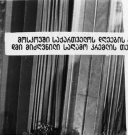
მოსკოვში საქართველოს ღღაბის განხილვა- დგი მიძღვნილი საღამო კაბელის თეატრში.