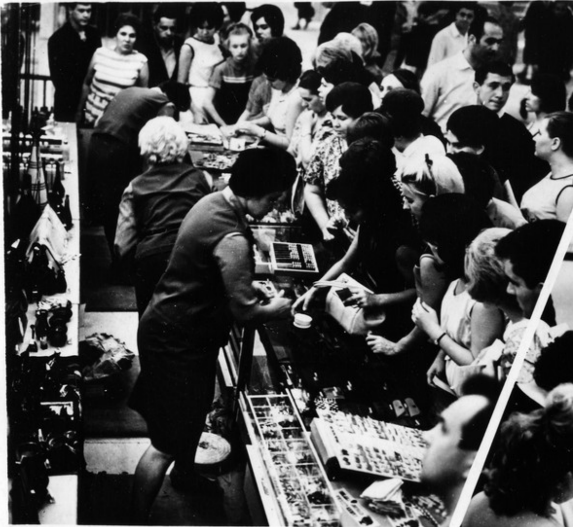
ქართული სუვენირების გაყიდვა.