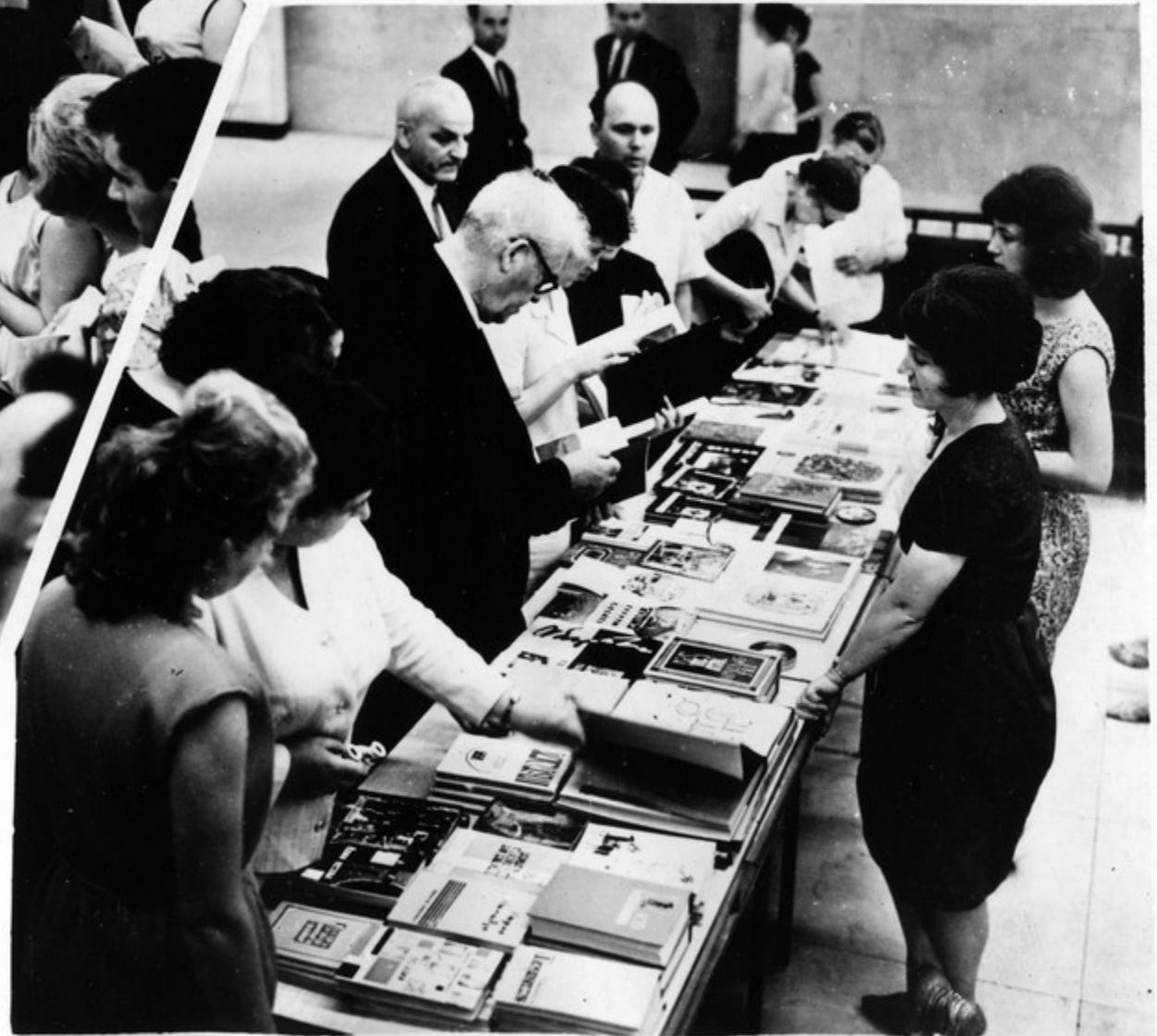
ქართული წიგნების გაყიდვა.