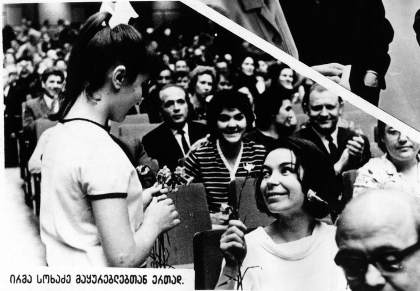
ე. ი. მიქოიანი მოსკოვში საქართველოს სსრ კულტურისა და ხელოვნების დღეების მონაწილეთა შორის.