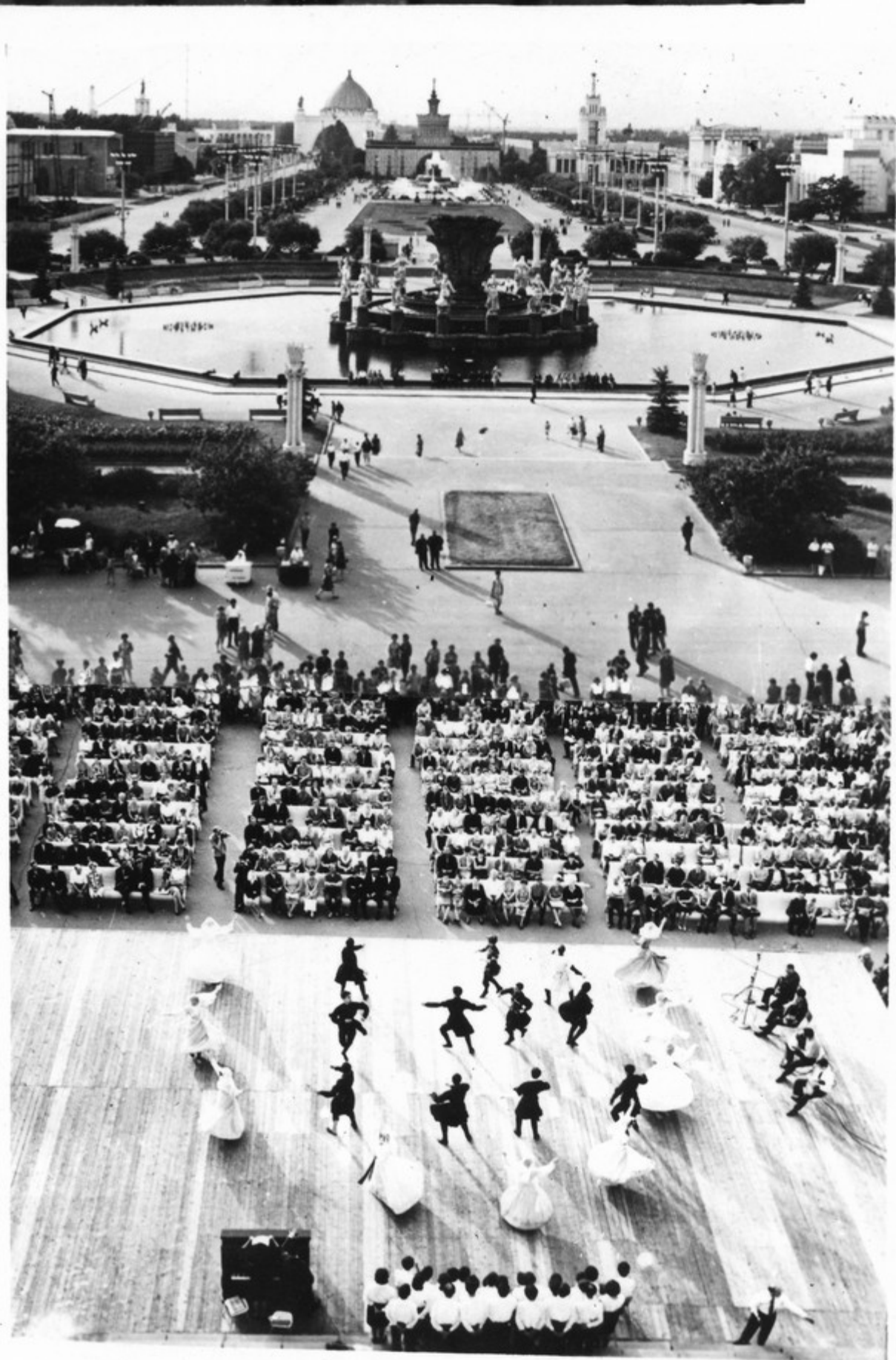
თვითმომჯებრი კორეაჟივიების გამოს- ვდა სსრ კავშირის სახალხო მეურნეობის მიღწევათა გამომუშანის ღია ესჟაილეა.