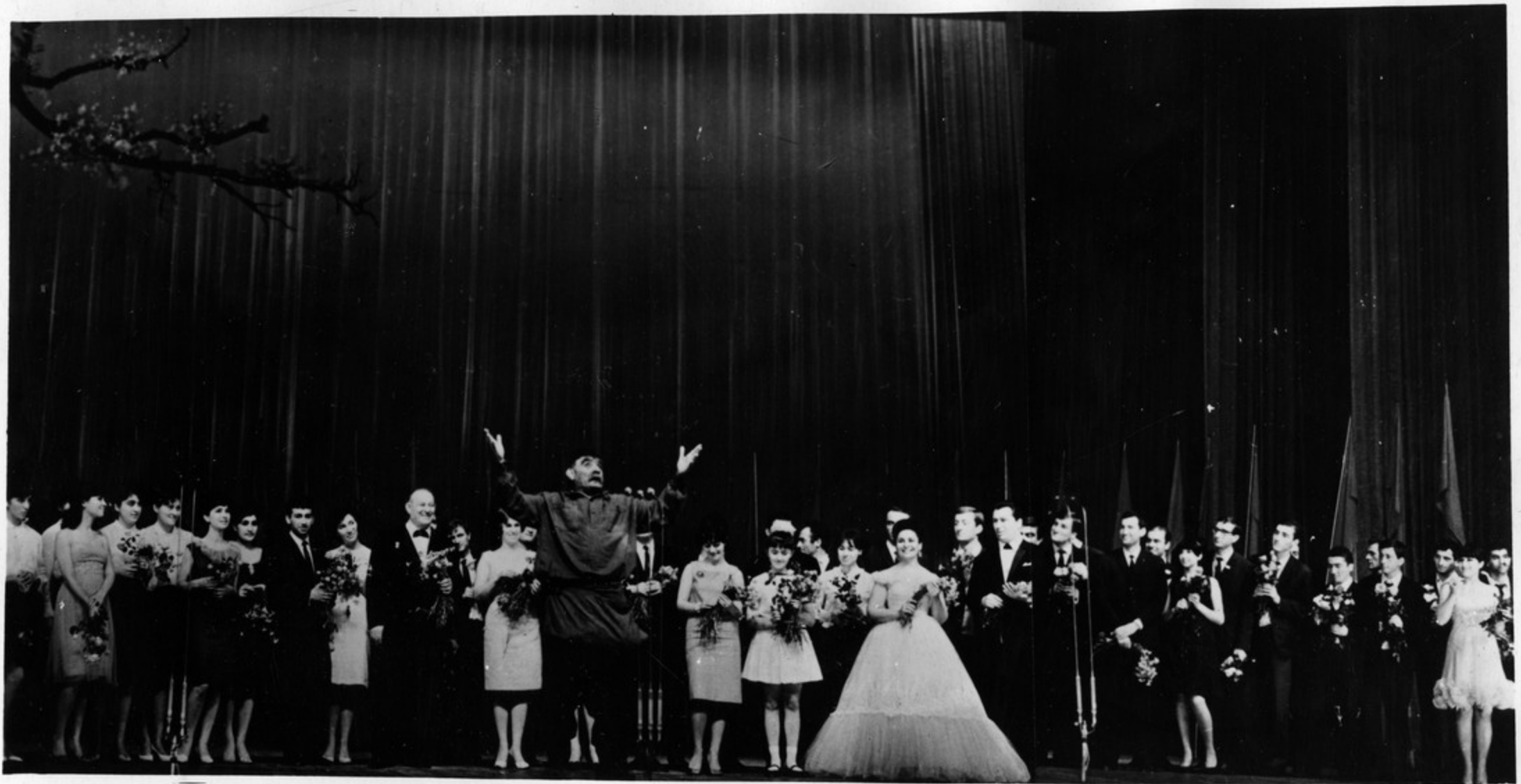
მოსკოვში საქართველოს სსრ კულტურისა და ხელოვნების დღეების დასკვნითი სეზონი. გაემართა სსრ კავშირის სპორტული პარადი. დანიშნული პარადის დასრულებით სსრკ-ს ზეპირი წარმართვა.