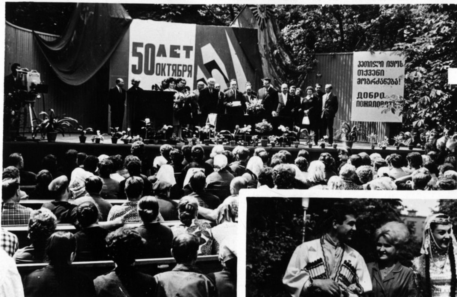
შეხვერა მოსკოვის ქაჩანა „კალიბრაი“.