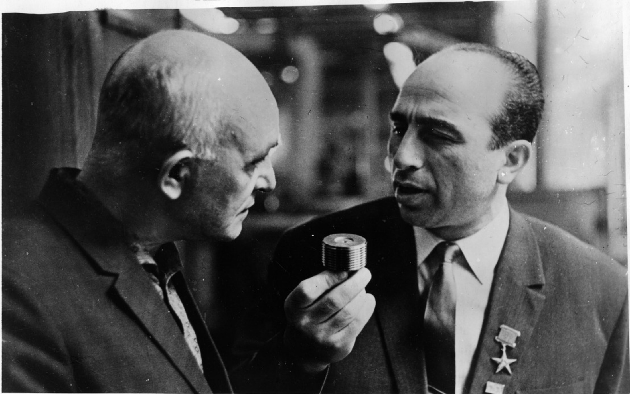
ქახანა კაღიბაის" აბწყობი ზეინკადი, აუნათის სუსა უბაღდესი საბჭოს დეპუტავი ე. კეაკოვი (მაკსენივი) და საქართველოს სსრ დამსახურებუდი აბსიონადიზავოკი, სოშიადისვუკი შაკოშის მშიკი ი. ხაზაკაბე.