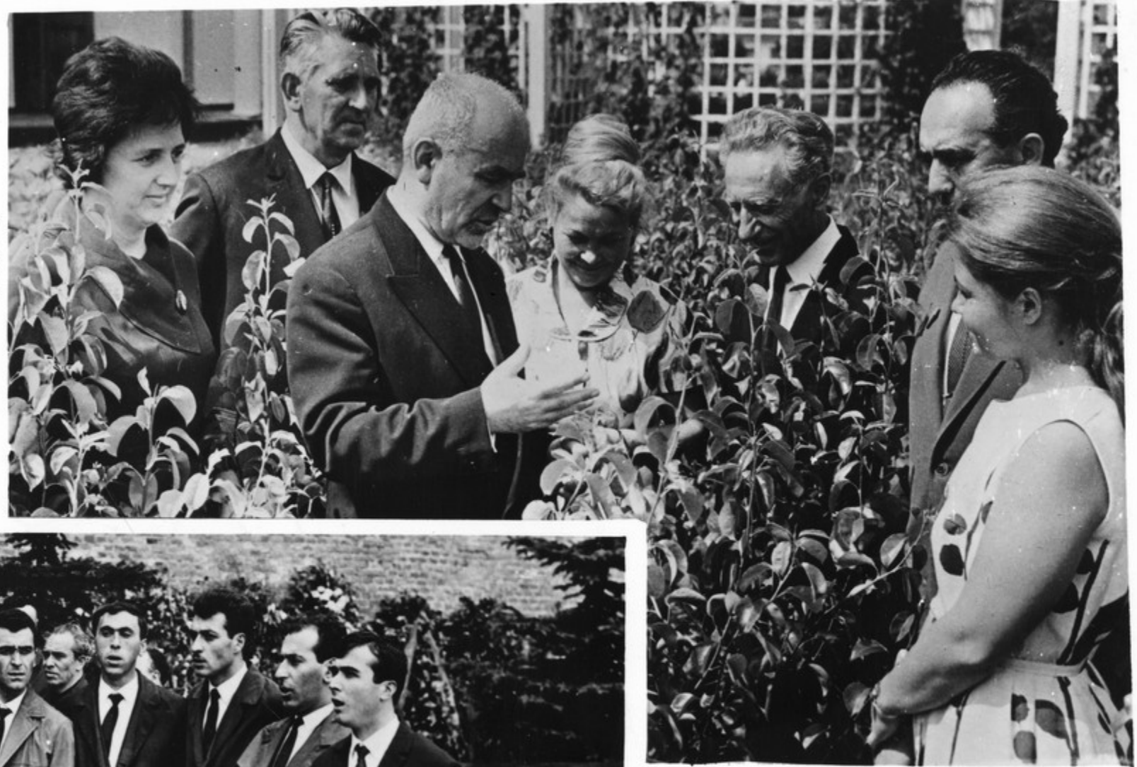
შენვერია სსრ კავშირის სახალხო მეურნეობის მიწნავათა გეოგრაფიის მეცნიერებრივი და მეცნიერების კავში- რიანი.