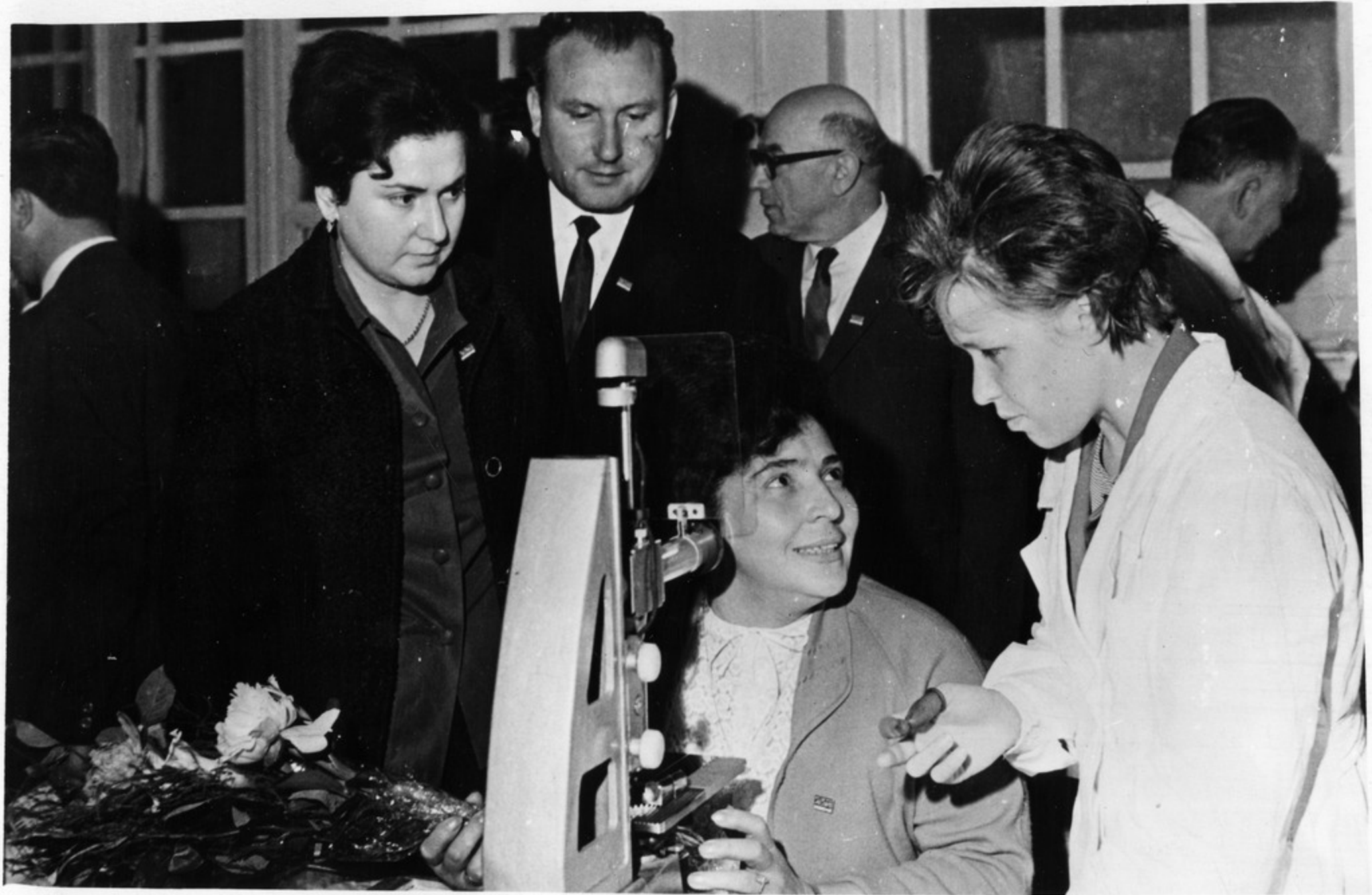
მოსკოვის სინსვაკუმენგო ქახანა „კალიბრი“.