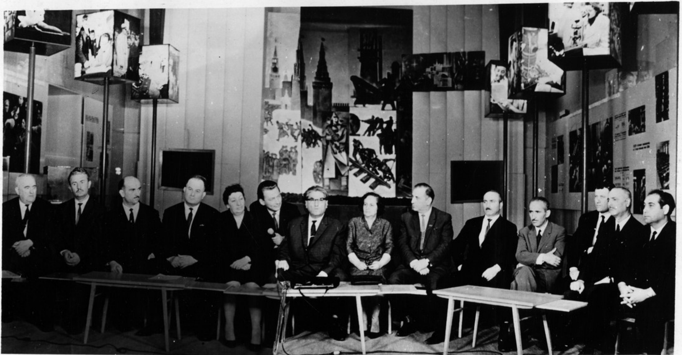
საქართველოს დღეების ბეგონის ბეგონსა სენჯალაი ველევიზიით