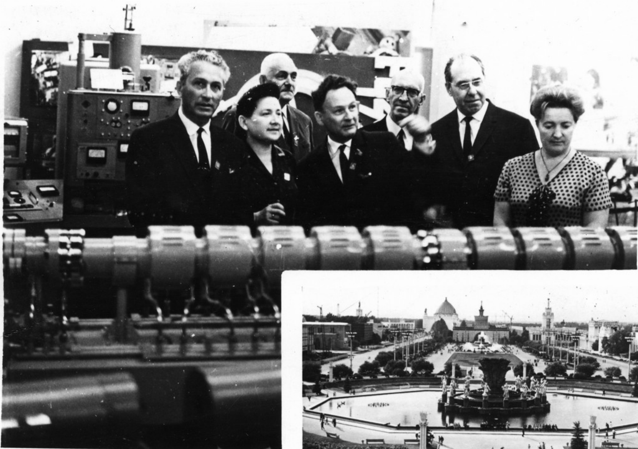
სსრ კავშირის სახალხო მეურნეობის მიღწევათა გამომუშანის სახალხო განათლე- ბის კავშირონები.