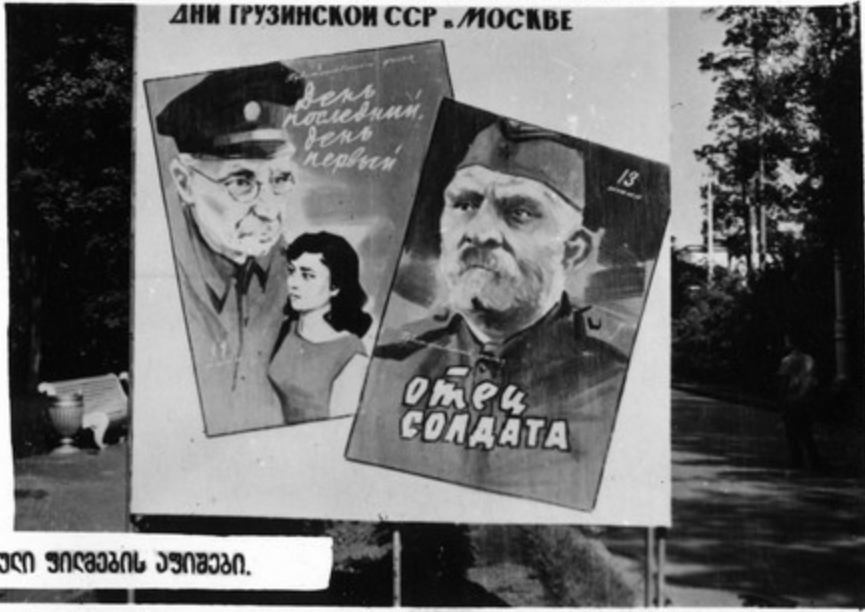
ქართული ფილმების აუზიფიფი.

მთელ მოსკოვში გავრავლი იყო დამაზი აუზიფიფი, რომდებიფი მოსკოვებლებს იწვევდნენ სსრ კავშირის სახალხო მუხანათის მიღწევათა გამოსვლის კინოთეატრში, კინოთეატრებში: „ქოსმოსი“, „რიგა“ და „პოღაიღი“, სადამს უჩვენებდნენ ქართულ კინოფილმებს.