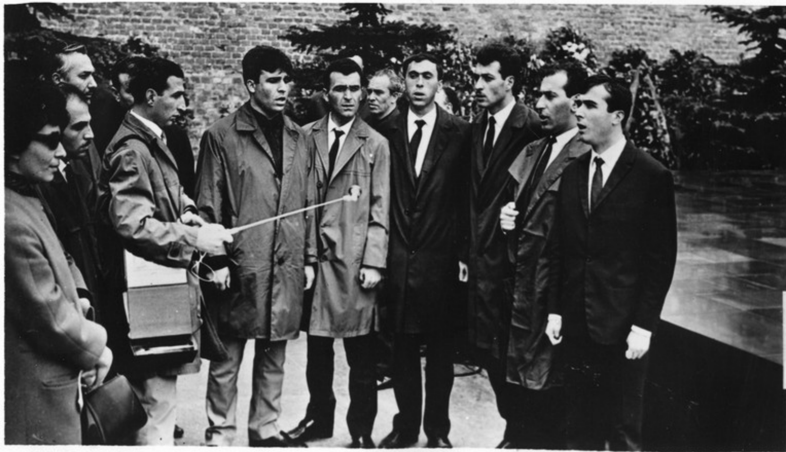
მიმდინარეობს ანსაზბდ „გორა- ღას“ შესრულებით ძველი ქართული სიმ- ღვინის ჩვენება.