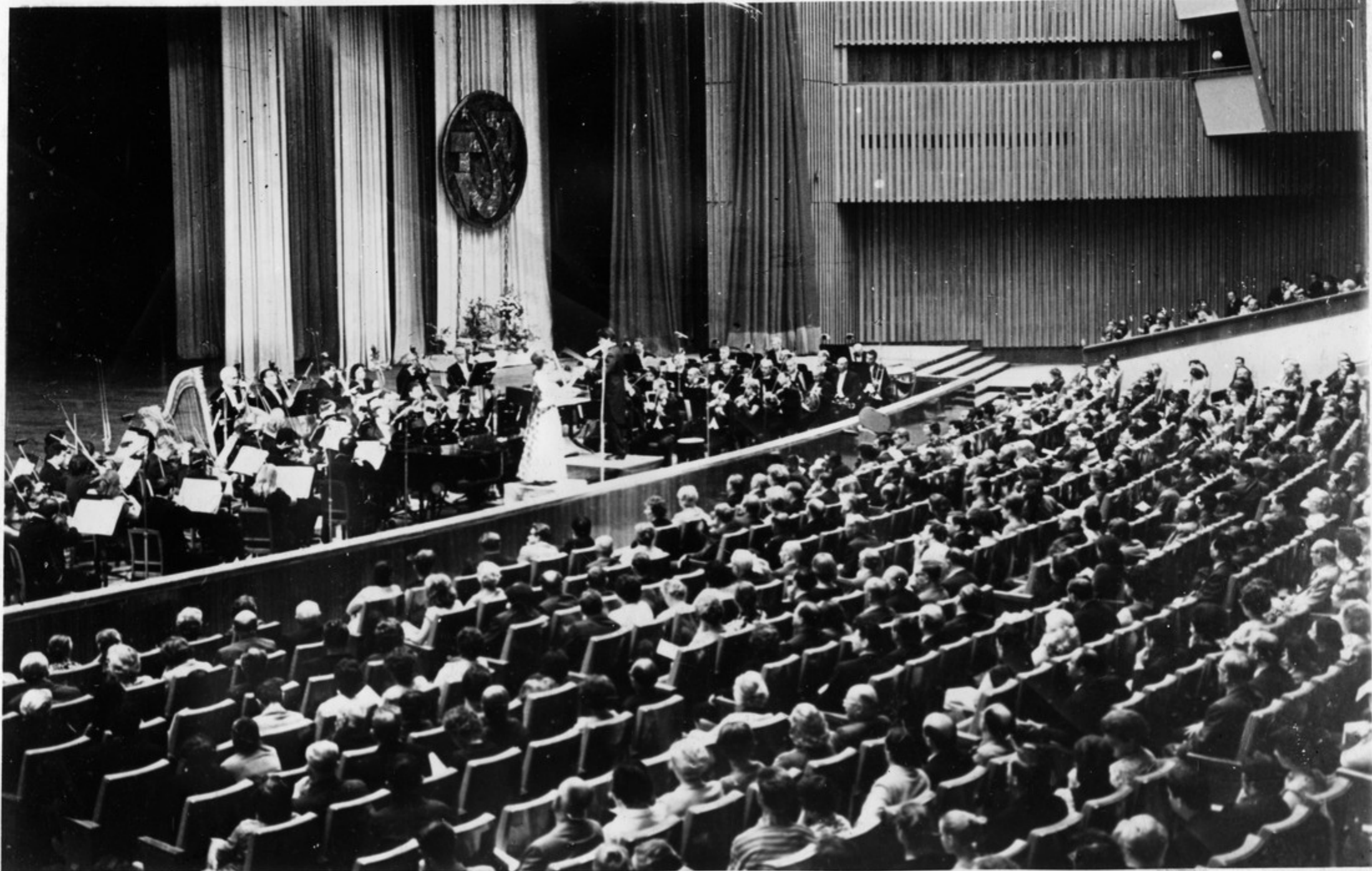
საქართველოს სიმფონიური ორკესტრის გამოსვლა კაბდის ყიდილობათა სასახლეში.