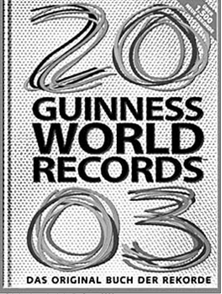
გინესის რეკორდების წიგნი - 2003