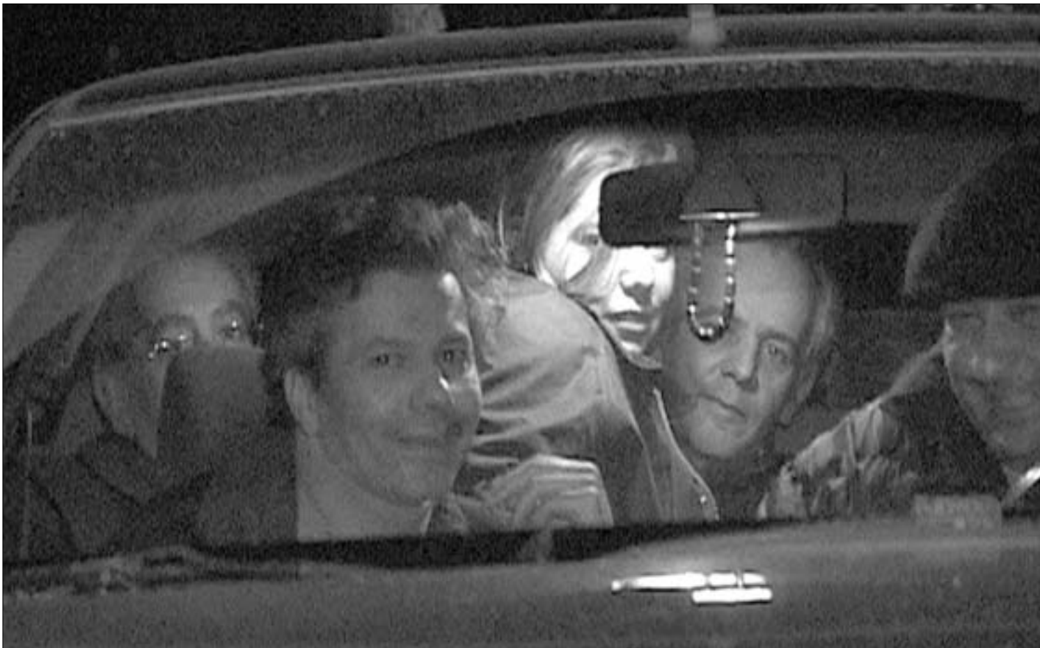
ტყევისიგან გათავისუფლების შემდეგ.

გატაცებული ესპანელების საქმის გამოძიება ესპანეთსა და საქართველოში ისევ გრძელდება. შინაგან საქმეთა სამინისტრო, გენპროკურორატურა და უშიშროების საბჭო კატეგორიულად უარყოფენ ესპანელების საქმის გამოძიების მასალების საკუთარ უწყებებში არსებობას. საბოლოოდ გაირკვა, რომ ესპანელების სავაჭროდო მასალები უშიშროების მინისტრის ხელშია. ვალერი ხაბურცანიანი ესპანელების საქმის შესახებ, გამოძიების ინტერესებიდან გამომდინარე, კომენტარზე უარი განაცხადა.