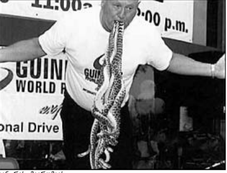
ვინ რას მიირთმევს