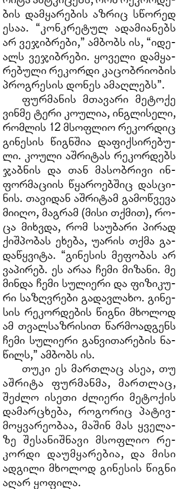
გინესის რეკორდების წიგნი - 2003