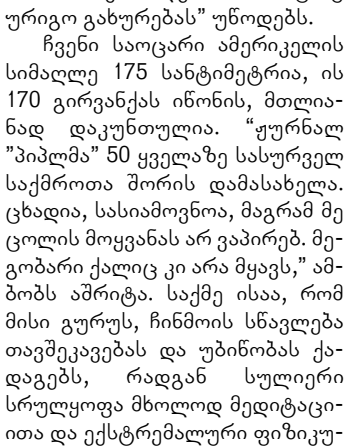
უღვაწივია და უღვაწივს