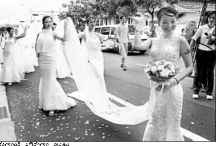
ძალიან გრძელი ფატა