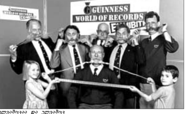
უღვაწივია და უღვაწივს