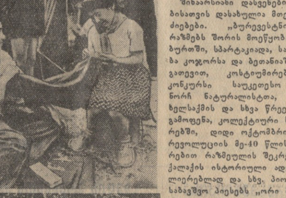
სურათში: ზეითი — პიონერები სალაშქროლ ემზადებიან ქვეყნის-დასარსებულ დროს პარის ხეივანში.