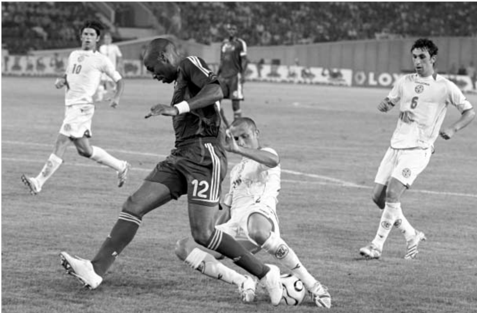
კიდევ ბევრი გააქვს სასწაული.

შორს ვარ იმ აზრისგან, რომ სხვა ტაქტიკური მონახაზის, ან სხვა შემადგენლობის დაყენების შემთხვევაში საქართველოს ნაკრები თუნდაც ქულის აღებას შეძლებდა. არც იმის სურვილი მაქვს, რომ ისეთი მაღალი კვალიფიკაციის მწვრთნელის მიზართა და ვიტყვი, რომ მისი ხელმძღვანელობით ქართული ფეხბურთი საგრძნობ პროგრესს განიცდის. თუმცა, ამ კონკრეტულ თამაშზე, ალბათ, თავად პერ ტომპოლერიც დამეთანხმება, რომ როგორც შეზღუდული იყო, ისე ტაქტიკის შეზღუდვაში კარგად იცავდა, რომ მეტოქეს ნახევარდაცვის ხაზში ეყოლებოდა ვიკირა, მაკელუდა, მალუდა და რიბერი, რომლებსაც თავდასხმაში ტერენტი ანრი დაეხმარებოდა. ამ ნახევარდაცვის ხაზმა მსოფლიო ჩემპიონატზე ფეხი არ გაანძრევინა თვით ბრაზილიის ნაკრებს, თავისი კაპიტნი და რონალდინიო-რონალდოებით. ტომპოლერმა კი ასეთ სიტუაციაში სამი ნომინალური თავდასხმელი გამოიყვანა - იაშვილი - არველა-