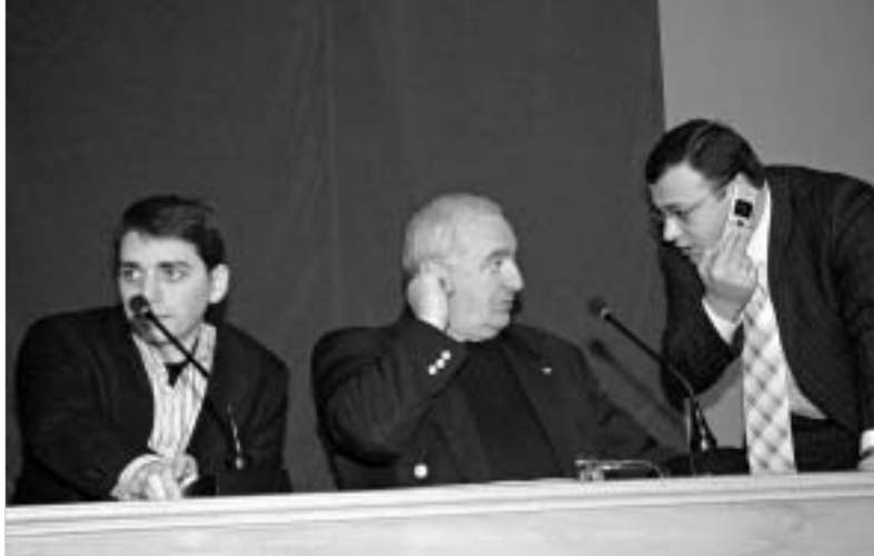
პარლამენტი საერთაშორისო ხელშეკრულებების რატიფიცირებისთვის ემზადება.

გიორგი "თურქული კრედიტის" გაერთიანებული კვლევა-ძიება დაიწყო ოთხი პარლამენტის ადგილობრივი დელეგატის თაობაზე 2004 წლის ივლისში "პარიზის კლუბში" მიღწეული შეთან-