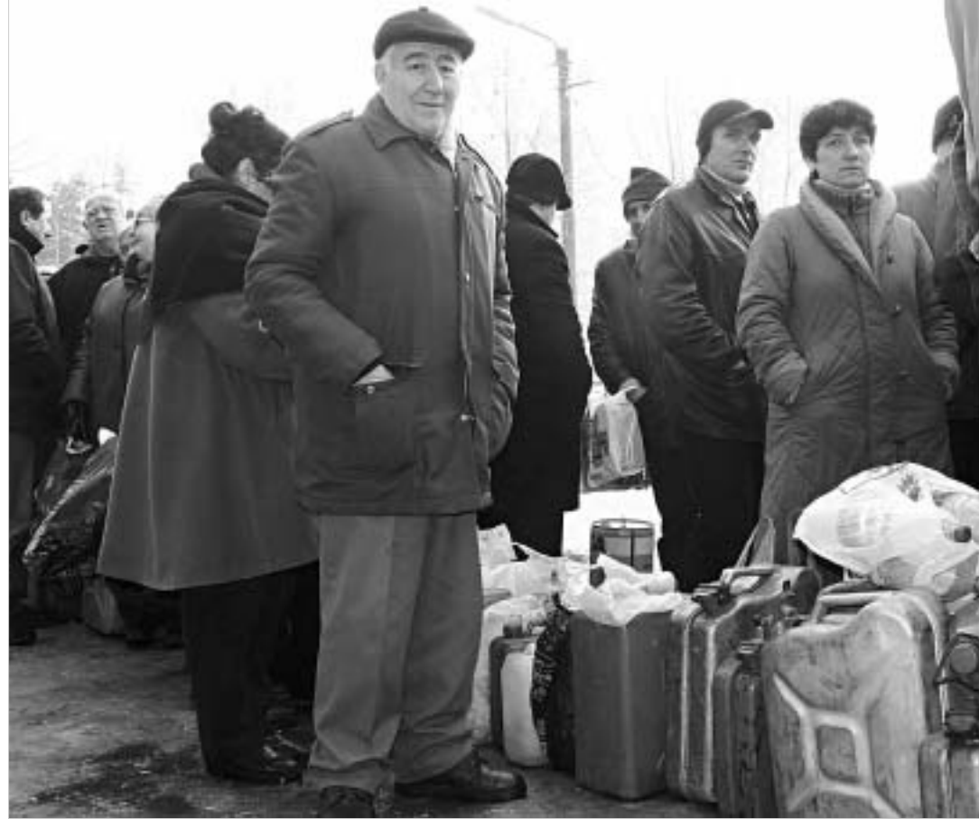
ნავთის რიგებს, ალბათ, ორ დღეში მოედება ბოლო.