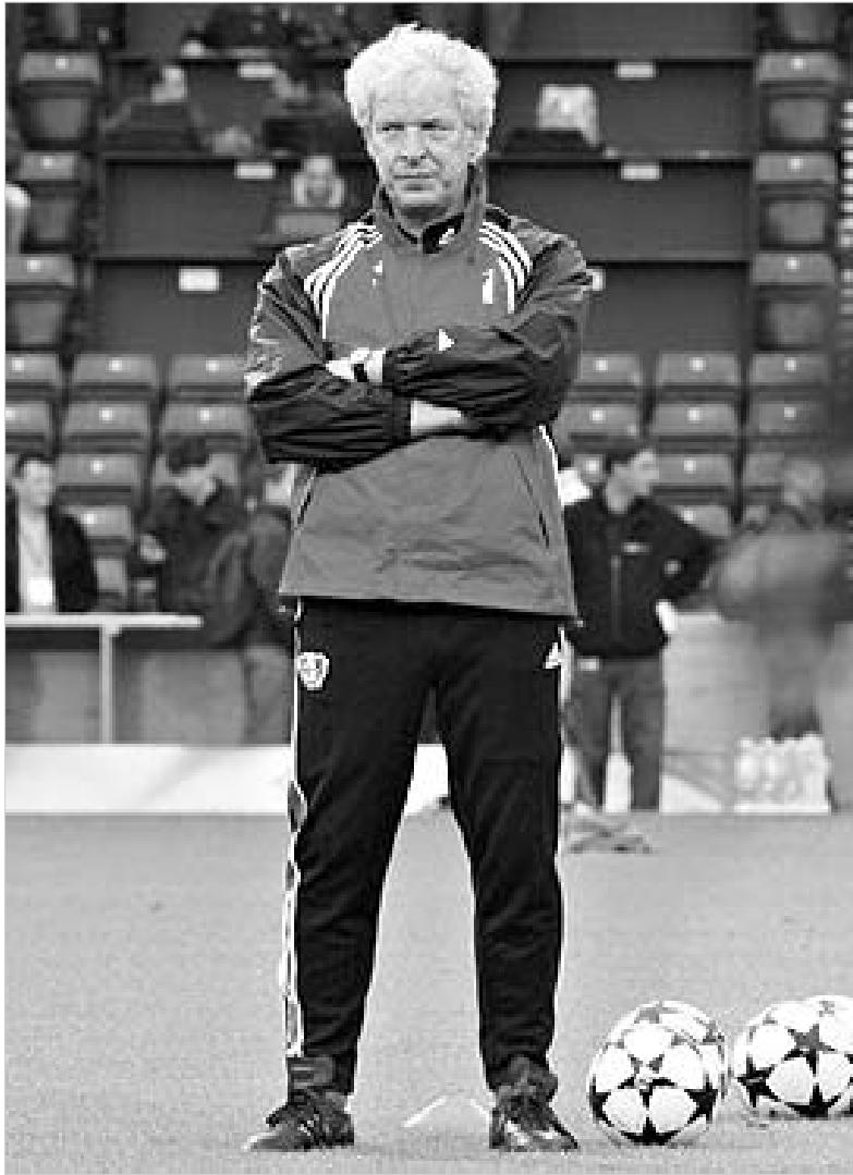
კლაუს ტოპმოილერს ბევრი თავსატეხი ექნება.

თუმცა, ამ გარემოებას უარყოფითად ერთად ბევრი დადებითიც აქვს. უპირველესი ისაა, რომ თბილისში მართლაც დიდი ფეხბურთი გვევლინება. ფინანსური თვალსაზრისითაც საქართველოს