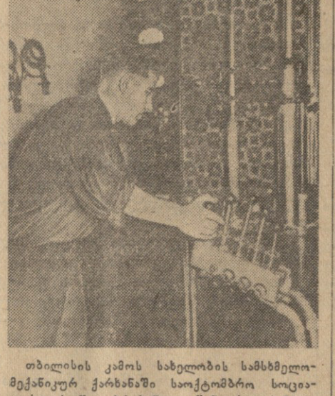
თბილისის კამოს სახელობის სამხმელეთ-მეცნიერებათა ინსტიტუტის სოციალისტური შეჯიბრების დაწყებისას სამხმელეთ-მეცნიერებათა ინსტიტუტის მდივანი მ. ყობაია...