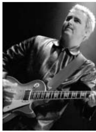
18 მარტს მოხდება. შემდეგ "პერლ ჯემს" უკვე ამერიკულ ქალაქებში მოუსმენენ.

ამერიკული როკ-ჯგუფი "პერლ ჯემი" ახალ სტუდიურ ალბომზე მუშაობას ამთავრებს და უკვე სიმღერების ნუსხასაც აქვეყნებს. ნლევანდელი სინგლი იქნება ელვის პრესლის მიერ პოპულარიზებული სიმღერის Little Sister-ის რობერტ პლანტის ელვისის ვერსია. როგორც პარმან, ოქტომბერში, ჩიკაგოში ჩაინერეს. მერვე სინგლი იქნება ახალი სიმღერის Gone-ის სადემონსტრაციო ჩანაწერი, რომლის დებიუტაცია ოქტომბერშივე, ატლანტიკ სიტში გამართულ შოუზე გაიმართა.