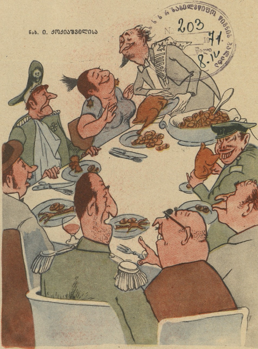
— ამჟერად ჩვენ მხოლოდ ფხეხები გვირგო.