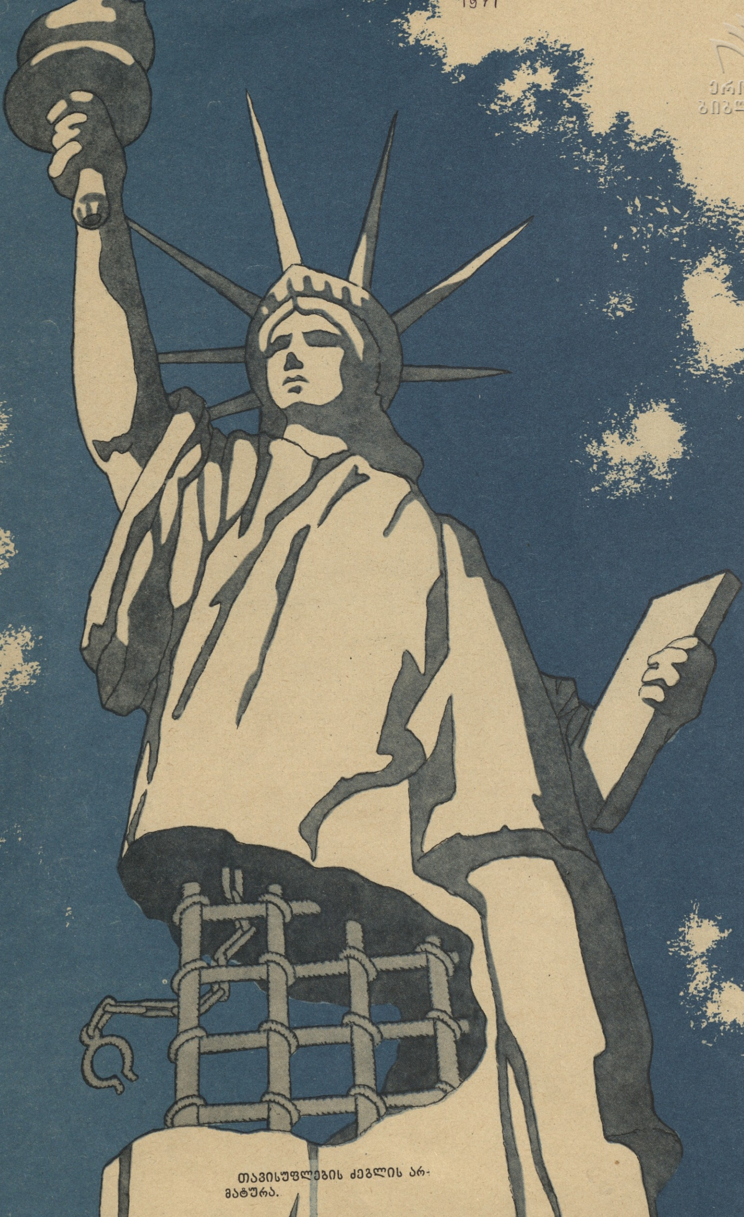
თავისუფლების ქვლის არ- მატურა.