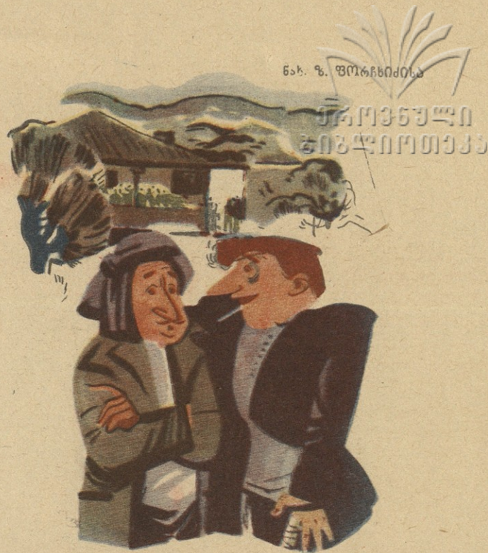
— გვიპეიფია, აბა, ვარლამთან! — ქორწილი კი არა აქვს, ქალხი აქვს. — რა განსხვავებაა, ქალხშიც თორმეიან, მღერეიან და ჩხუბობენ!