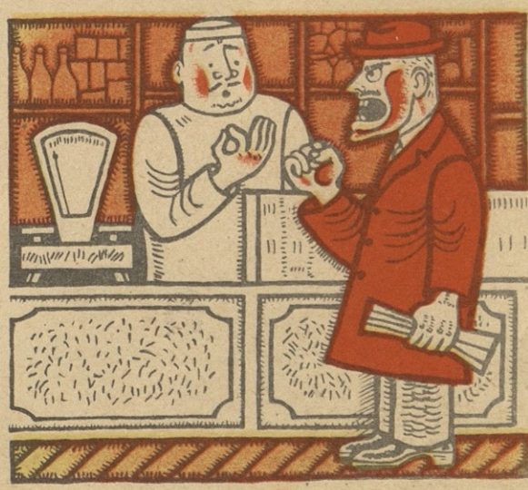
— ჰერ არაფერი ამიწონია თქვენთვის და რატომ მლანქავთ, მოქალაქე? — ისე, პროზილაქტივისათვის!