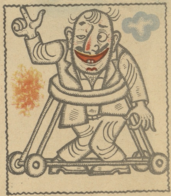
ჰოჰინა ჰუჩაში მოხმბილა ლოთეგისათვის.