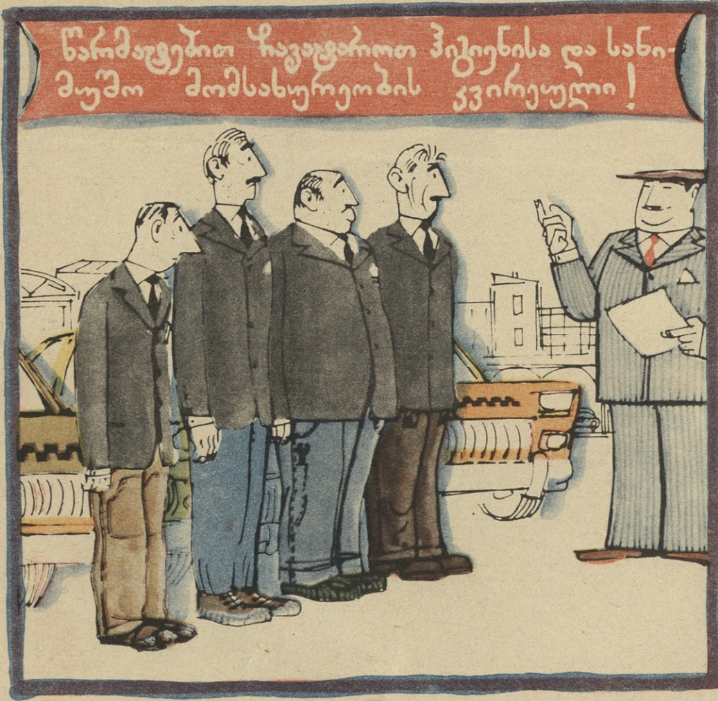
— გაუქმდით, გიჟებო, ჰიკენას, ორ დღეში დამსაჯრდებო კვირეული.

სალამი, ჩემო ცოლ-შვილო, წერილს გწერ აგარაკიდან, მალარიის ვიხდი, ცოცხალი თუ დაგიბრუნდით თხუთმეტ კვადრატულ ოთახში დგას ექვსი კაცის საწოლი (აქ არ წამოვა, ვისაც ჰყავს ერთგული შვილი და ცოლი) სადილობამდე კარგად ვარ და ცუდად ჰხოლოდ მერე ვარ, მენიუს როცა ვიგონებ, წინასწარ გული მერგვა: საუზმედ — როგორც ყოველთვის, არის ცომ-ცომი კატლეტი, თუკი შექამა ბოლომდე, ვერ მოინდლებს ათლეტი. სადილად — უკარტოფილოდ „ბორშის“ და მღვრიე „შჩის“ ელი, მეორე — გახლავთ კატლეტი, მაგრამ იგივე უნიციელი. თუ ლუკმა პირში ჩაიდე, აღარ გადადის სახაში, კიდეც კარგი, რომ იქვეა, კაფე, სამწვადე, სახაზე. სანამდე ვისადილებდე, „ტაბლეტი“ წამალს უწინ ვსვამ, ან მომკლავს მუცლის ტკივილი, ან მომიწინებებს კუჭის წვა. სულ მესიზმრება ღამ-ღამით მჭადი, პრასი და სალათა... მოკლედ, ჩემს დასვენებაზე დაიწერება ბალადა. იმის ოჯახი დაიქცეს, ვინც მე მიშოვა საგზური, ყველას ჰგონია ზღვაზე ვარ დასასვენებლად წასული. ზუსტად ვარ, მტკივა გულ-ღვიძლი, რაღაც საეჭვოდ მახველებს, ჰა, დროზე ჩამომაკითხეთ, სანამ სხვა გამომახველებს!