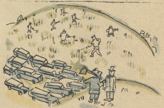
— ახლაც ბავშვებზე მამან-ჯაცის არ იყვებით, ხომ ხელკმთ მთელი ბრძანა საკუთარი მანან-გით მოვიდა!