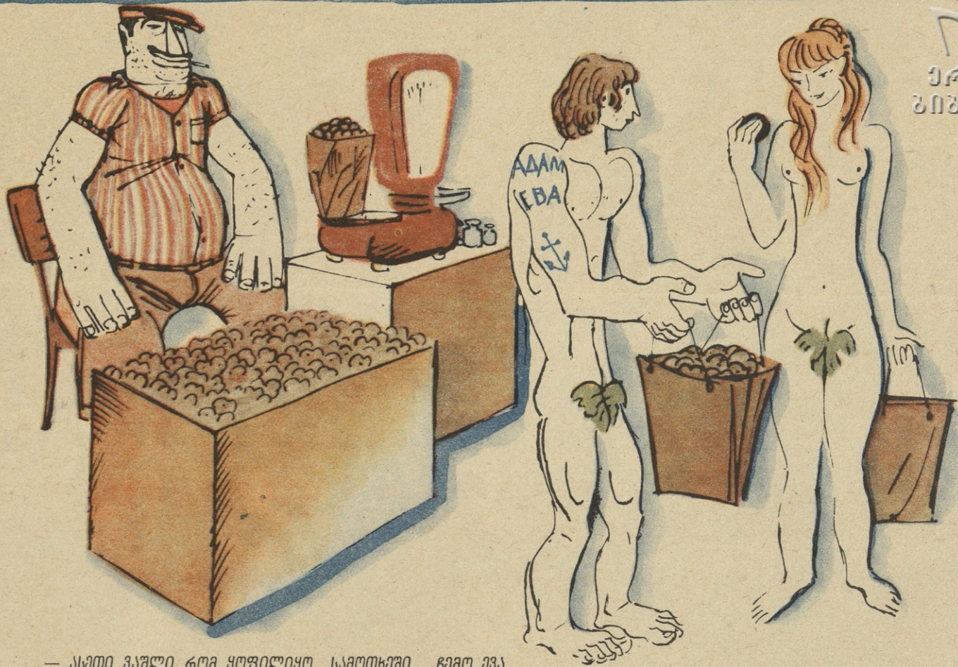
— ასეთი ვაჭალი რომ ყოფილიყო სამოთხეში, ჩემო ვვა, ხომა ვერ შეამსდებოდა?