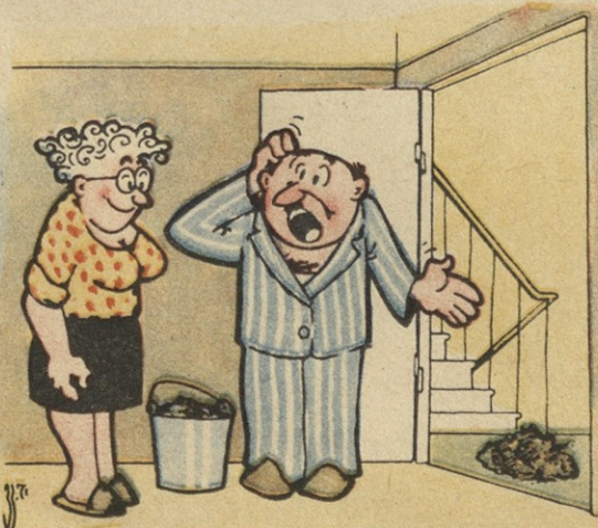
— უწინ ბავშვებს უგებდნენ კარზე, ახლა ნაგვის მოშლვებ დაიწყეთ.