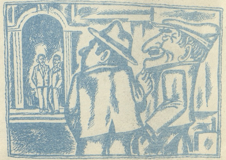
ამათსავით რომ სულ ფეხბურთის კომბინაციებზე ვფიქრობდეთ, ამათსავით გიბეგამოფხვილები ვიქნებოთ.

თანი და სად ყაითანი, სად სუმბული და სად ბუმბული... შენზე ტრფობით დამეგები არ მძინავს, შენზე ფიქრით გული გადამელია. რაცა ვარ, აი, ესა ვარ, თუ ცოლად გამომყვები, ქეთო-ჯან, წყნეთში დედუღეთის მამულს გავყი-დი თავის ვირ-ჩორბანანად, მეზობლების ჯიბრზე სამედიცინოზე მოგაწყობ და, ჟიგუ-ლის ნაცვლად, პრალიოტკას გიყიდი. რვა ნომრით ელოთბ, ცაზე მთვარემ სუ-ლი დალია, შარაფის მუზა გამოვცალე, შუა-დამეა, დილის შათორი, აზამბარი ეშხით მთვრალა, თუ გაგაფრინე, ჩემთ ქეთო, შენი ბრალა! დარროს ფაიტონით ჰაზირას ხელით გიგ-ზავნი პეტროგრადიდან ჩამოტანილ ლაქის