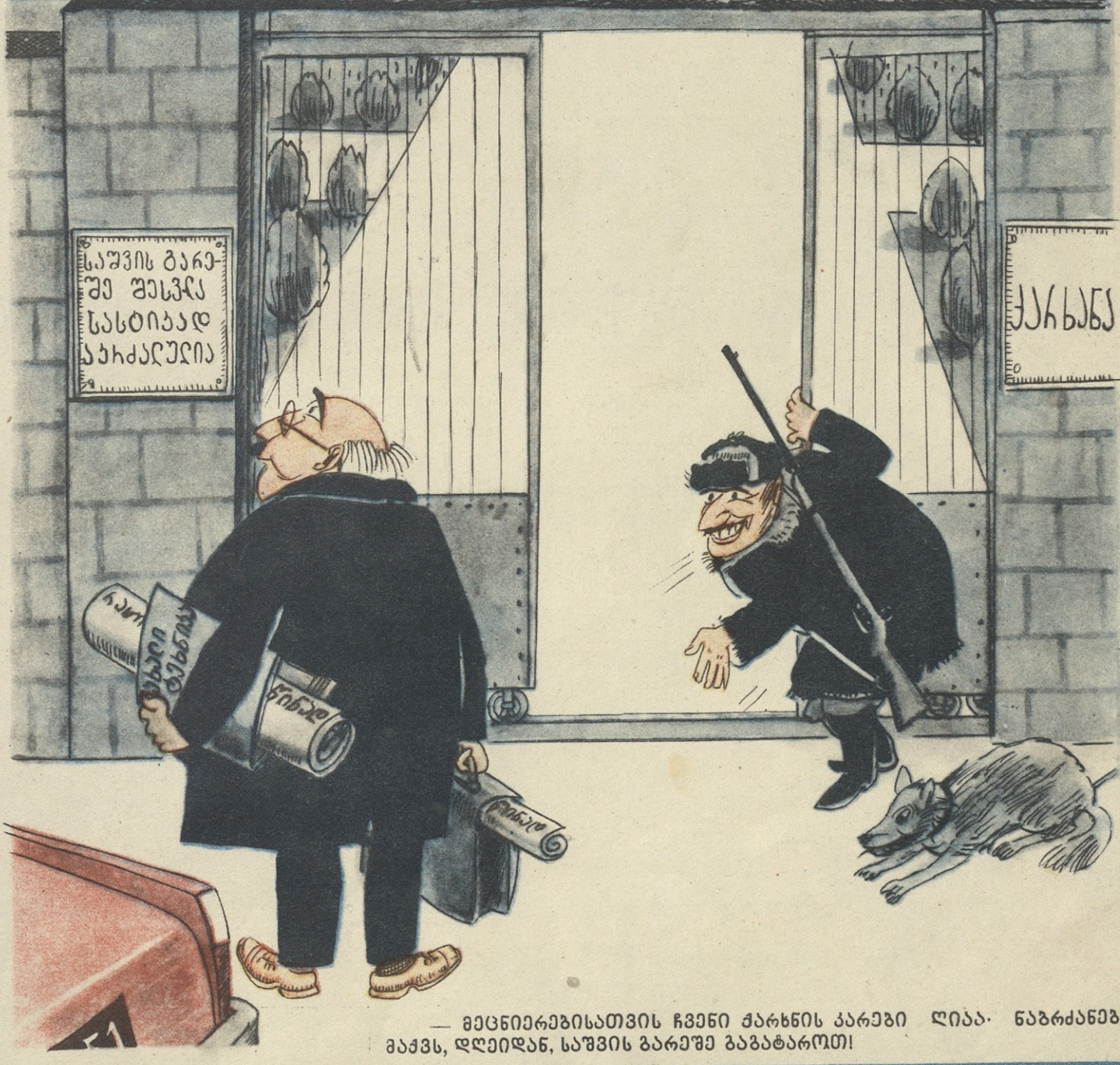
— მუშაობისთვის ჩვენი ქარხნის კარები ღიაა. ნაბრძანები გაქვს, დღეიდან, სუფის გარეშე გაგატაროთ!

საბჭო XXIV ყრილობის ისტორიული გადაწყვეტილებების შესაბამისად ქვენი უფრო ხშირად დასახლებულ რაიონებში უნდა დაეწყოს მუშაობა