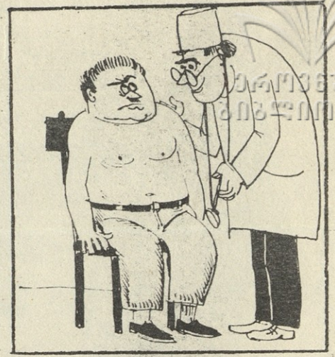
ფეხბურთის გულშემატკივრის სამედიცინო შემოწმება სპორტის დე-ფაქტოს წინ.