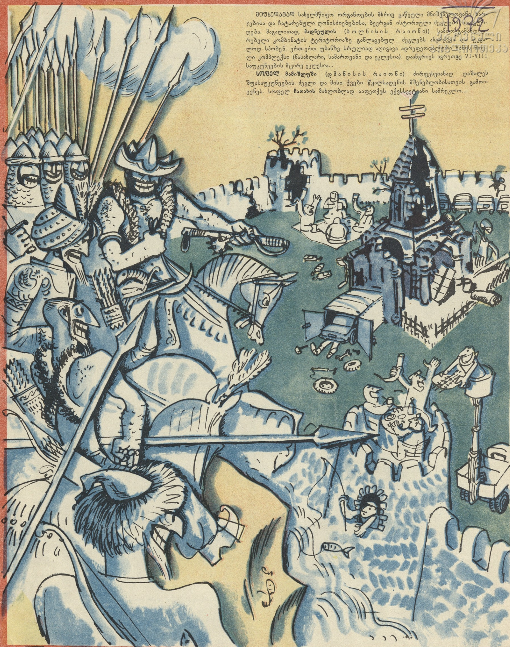
— ალბა! რა ტყუილად გამოვილაშქრეთ!.. ამ თვითონ აუოხრა-ბიანთ თავიანთი ქვგლები!