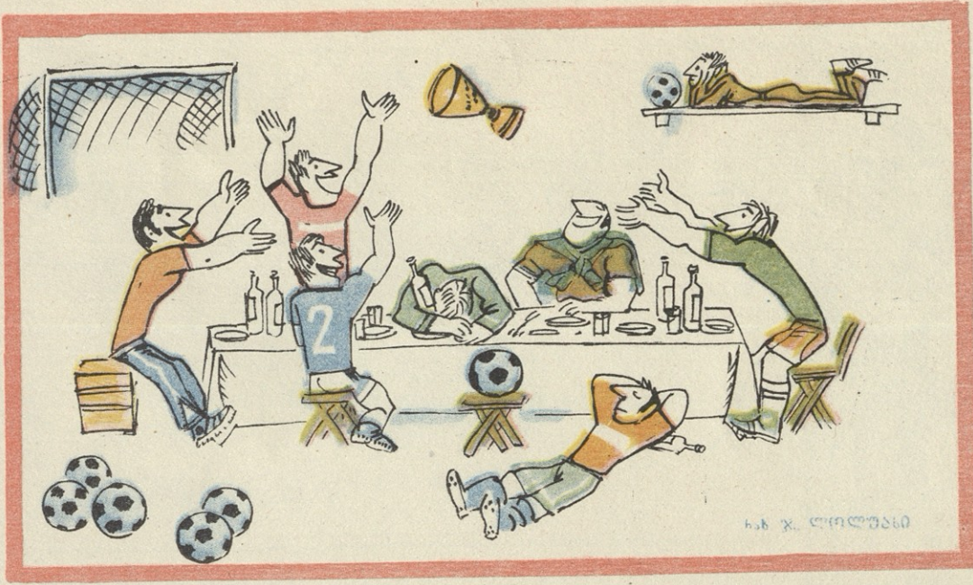
ნახ. ა. ლომიძისა