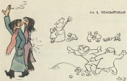
ნა. ბ. შირინბაღვაძის