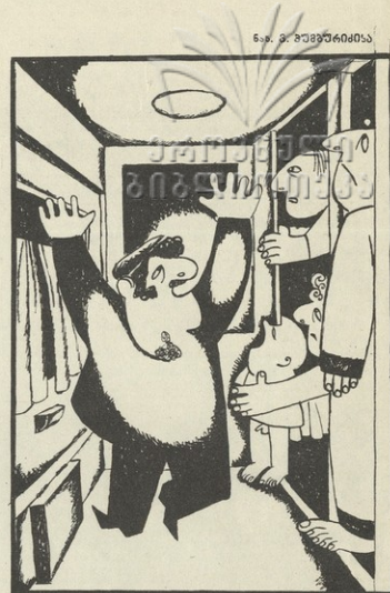
ნა. ბ. შირინბაღვაძის

— თქვენსა ვარ, თქვენსაოოო! — მეს პი ხარ თქვენსა, მაგარა ჩვენი ვაჟი/მეუღლე!