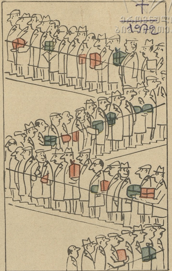
როცა უფროსი ქალი