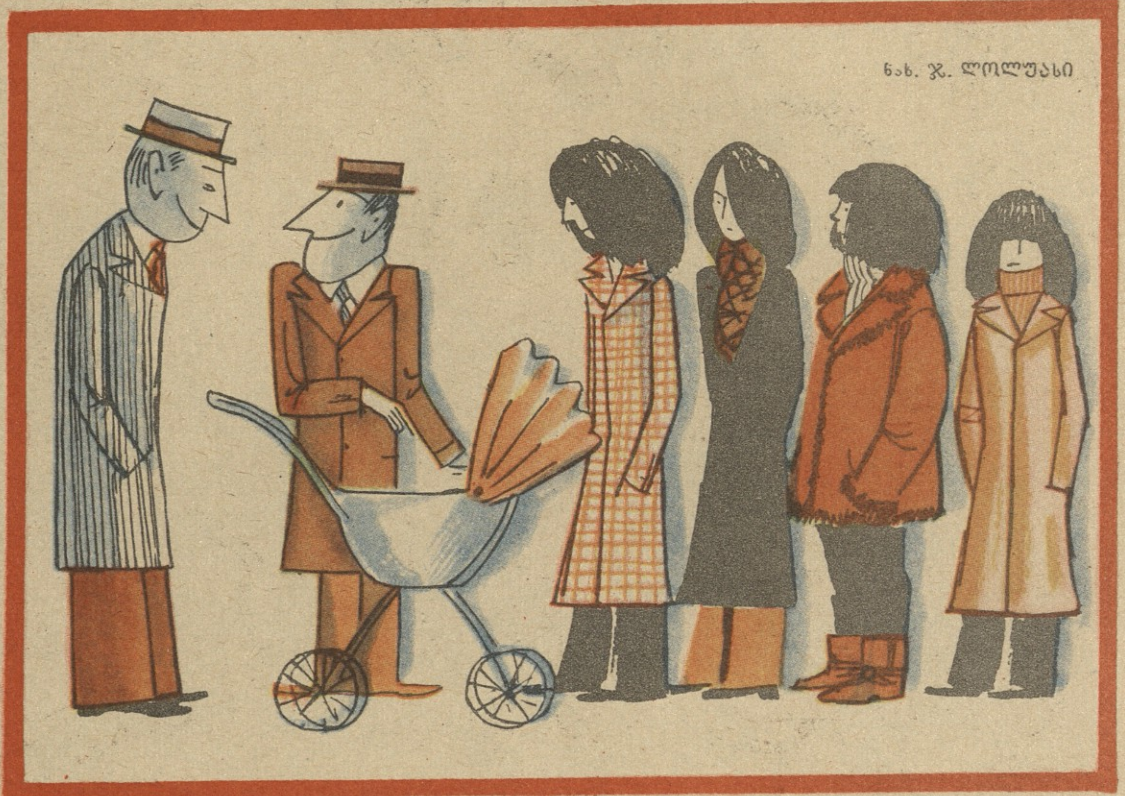
ნა. ჯ. ლოლუასი

— რად გინდა, ქალგატონო, ხელით თავზე დადგომა, დღეს ისე- დაც დავლევ, 8 მარტია!