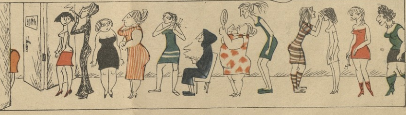
— ქსენი, დიდიდან რომ მოლიდა დიმიტროს, რა საბამ მაშხ ასეთი? — კარფირი, გიშვი, ბაშინახევაში ვართ, მ მარტი უნდა მრეკოთოსნი!