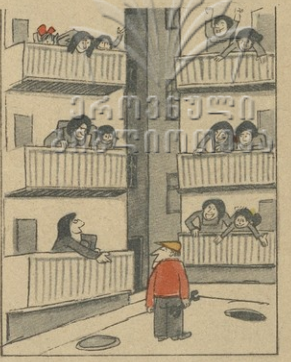
— ჩვენი შობს ქალბარო, მიიღეთ ჩხხხხ სა-ღვთსაქალაქო ვეულბა მხირფანი სარეპირი — ცხელი წყალი!