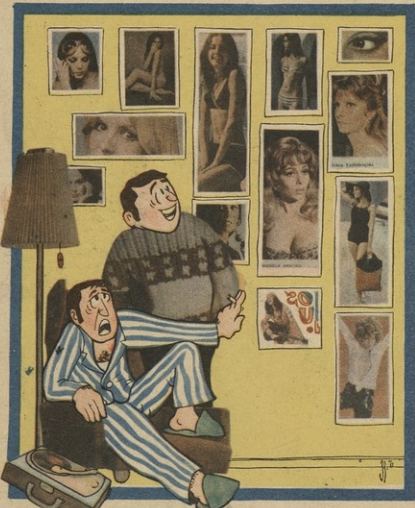
ფ. ა. აფხაზი