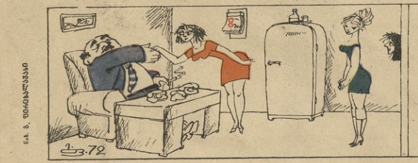
ფ. ა. აფხაზი