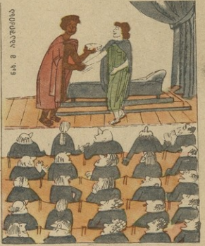
— ახანაკევი! მიღებოშ დუღაშინებს ღარ-ნოთაშ ვაშ ქალბარო, ღირხაშის სახლიში ვა-ღვთსაშ გას ქალბარო დღეს, მ მარტა და მაკლ-საშ ვასან სარეპირი — იმპორტული მხირფან-ხირფანს კოვალბას!