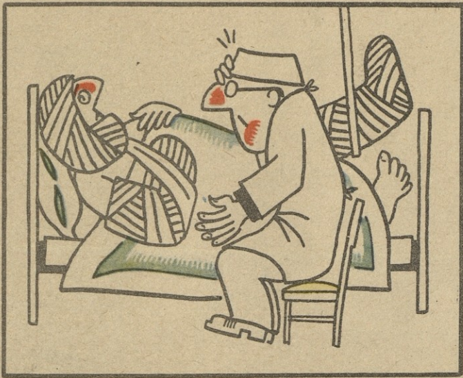
ნ.ბ. რ. სანადირბისა

— მომიყვებით, როგორ მოხდა ყოველივე ეს? — 8 მარტს მუდლისათვის საჩუქარს ვემზადი, კარგი ვერაფერი ვიპოვნე, სახლში ხელცარიელი დავბრუნდი და მერე არაფერი მახსოვს.