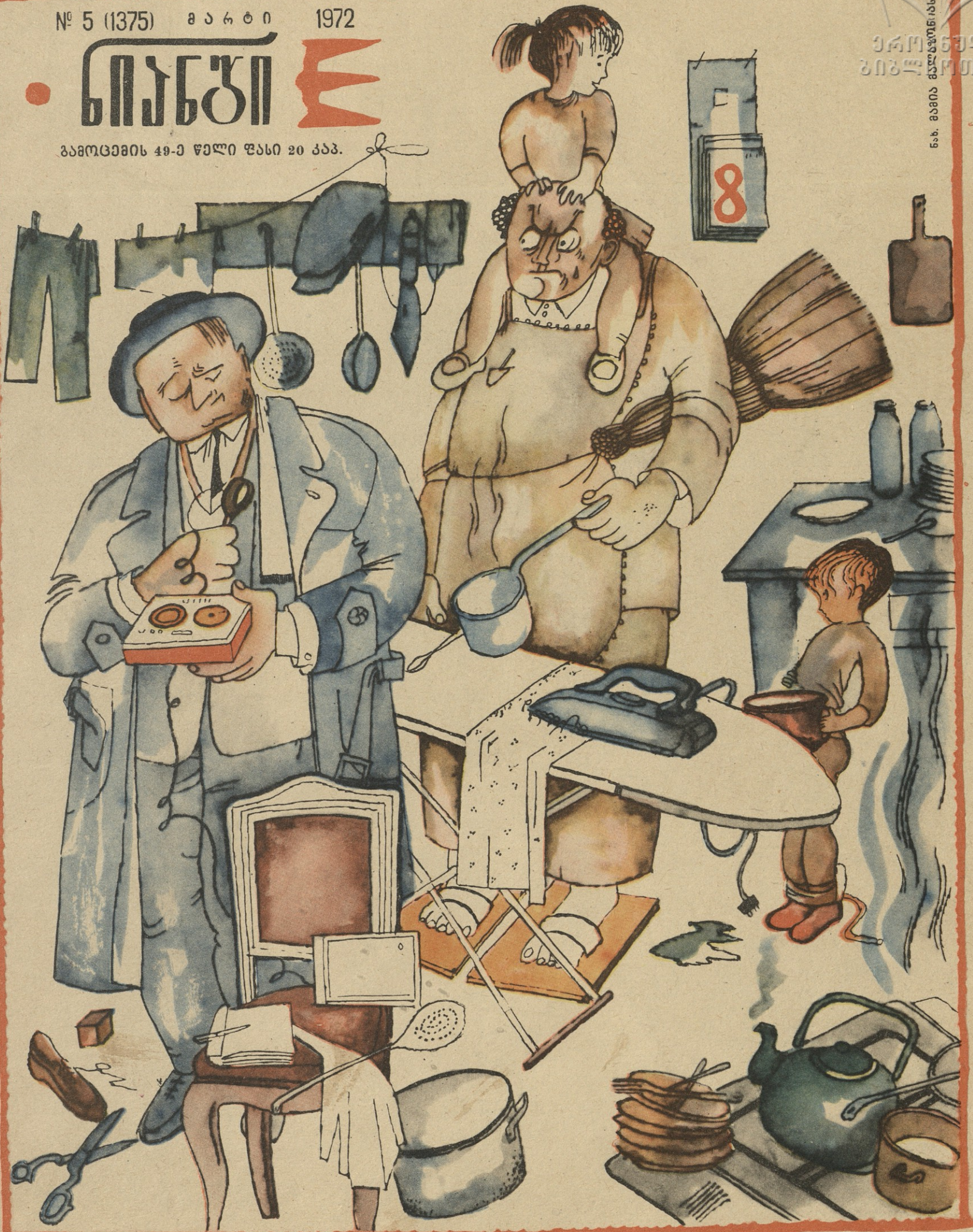
— რას იტყვობთ ღიასახლისის ურომაზე?