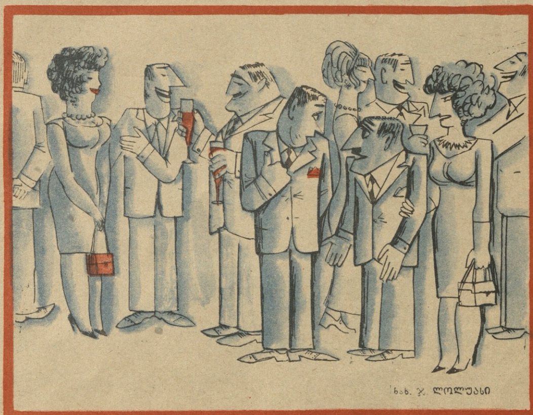
ხ. ხ. ხ. ხ.