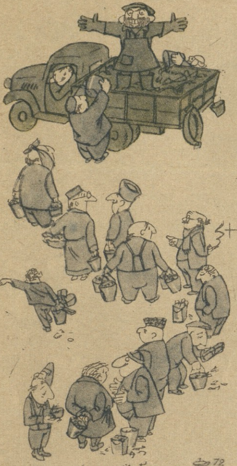
ნ. ბ. შირვაზაძის ნახატი

— ვა, დღეს ერთი ქალი არა ჩანს, რომ რვა მარტი მივუღო!