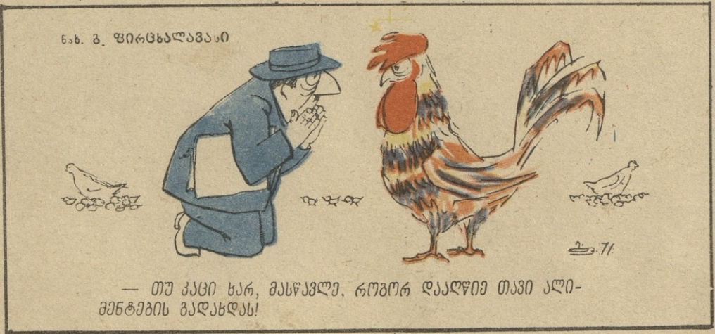
ნ.ბ. შ. შირცხალავაი

— თუ კაცი ხარ, მასწავლე, როგორ დააღწიო თავი ალი-მენტების გადახდას!