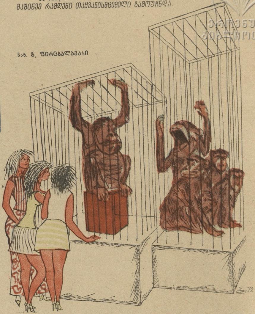
ნახ. ზ. ფირცხალავასი

— ხედავ, როგორც კი დაირტყა იყოლირებული გალია, მაშინვე რამდენი თაყვანისმცემელი გამოუჩნდა.