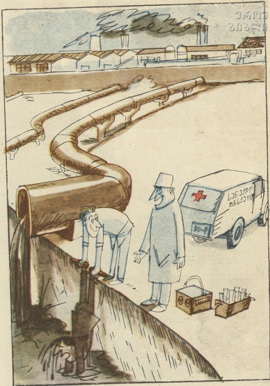
— მყოფა, მყოფა, ნამდვილად ჩემი ქარხანა წაშლას მდინარეს!

ყველა ამჩნევს უსაქმურად რუსთაველზე მდგარს, უცხო-უცხო ტანსაცმელით რომ იმშვენებს ტანს, იბლინძება, არასოდეს სხვას არ მისცემს გზას და პროსპექტის ლამაზმანებს სულ თვალებით ჭამს. ჰყვება ძველ-ძველ ანეკდოტებს და აცინებს ხალხს, საქმიანი საუბრის დროს აღარ იღებს ხმას. ინსტიტუტში ისე მოხვდა, არც უგრძნია მას, ლექციებზე თუ დაჯდება, ისიც ცოტა ხანს. გამოცდების ჩაბარებით არ იწუხებს თავს, რადგან იცის, რა ძალა აქვს ტელეფონის ზარს. თავის პარიკმახერი ჰყავს და მეერავიც ჰყავს, აღარ იკლებს ბაკურიანს, ზაფხულობით — ზღვას. რესტორნის კარს ისე ადებს, ვით საკუთარ სახლს, მამის ხარჯზე რომ ქეიფობს, სირცხვილი არ წევას. რის მშობლები, რა სამშობლო? მსგავსი არა სწამს, თუმც სუფრაზე საქართველოს სადღეგრძელოს სევამს. ყურს არ უგდებს, მის შესახებ ვინც რა უნდა თქვას, მან თავისი მიიღოს და წისქვილმა კი ფქვას. არც ფანქარს, არც კალამს ხმარობს, არც თესავს, არც ხნავს, სხვა შრომობს და ის კი მარტო ერთობა და ჭამს. ერთი მითხარ, მაგის პატრონს პატრონი თუ ჰყავს?! ხნავს,