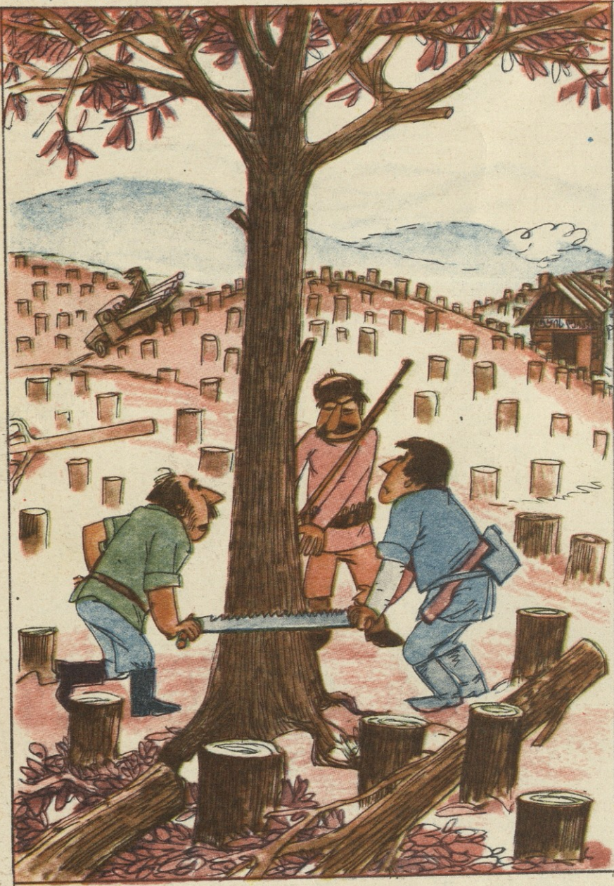
— შუაჩრეთ ამ ხის მოჭრა! გოლოს და გოლოს, მთელ ტყეს ხომ არ გაუჩინებენ?!

პირველი ნახვისთანავე გამაგიყე, გულში ჩამივარდი და მოსვენება დავკარგე. დიდხანს ვოცნებობდი შენს ხელში ჩაგდებაზე. ბოლოს აიხიდა გულის წადილი — ჩვენ ერთ ჭერქვეშ, ერთმანეთის პირისპირ ვართ!