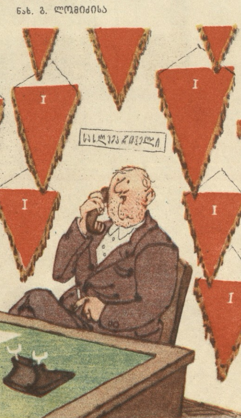
— ზოგიერთებს თვითონ არა აქვს წყალი, შენთან თუ სასურავიდან ჩამოდის, ბედნიერი კაცი ყოფილხარ!