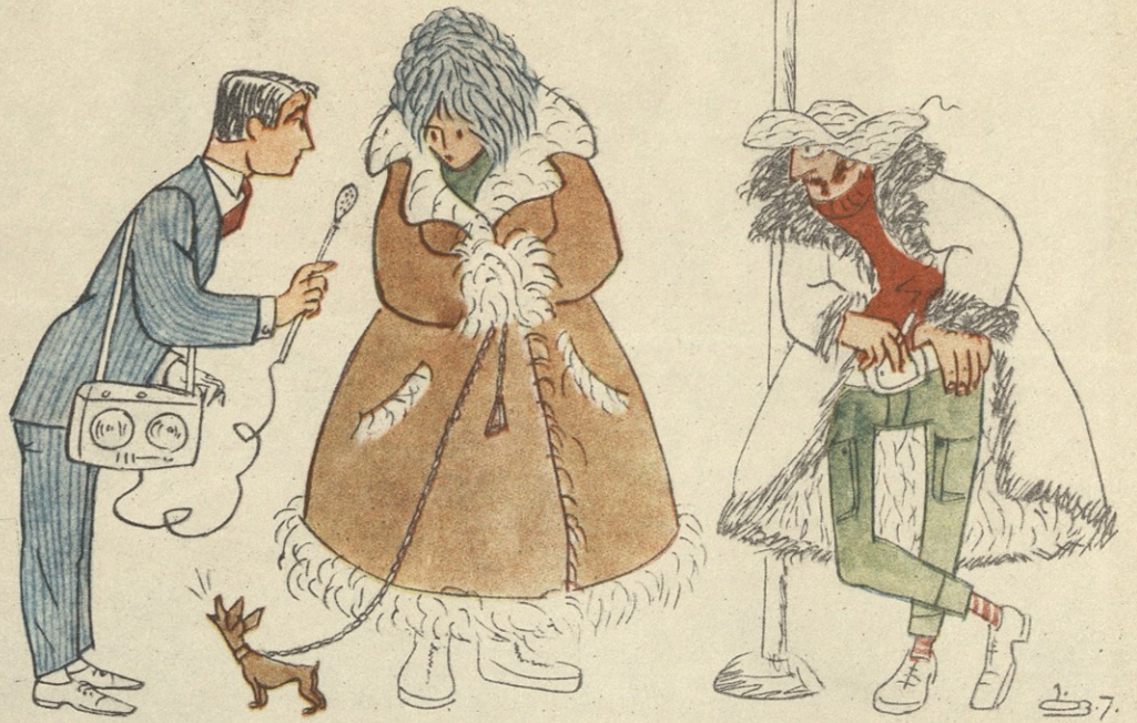
— გთხოვთ, გამცემთ პასუხი ერთ კითხვავზე: როგორ გამოიხატოთ თქვენმა ცხვარმა?