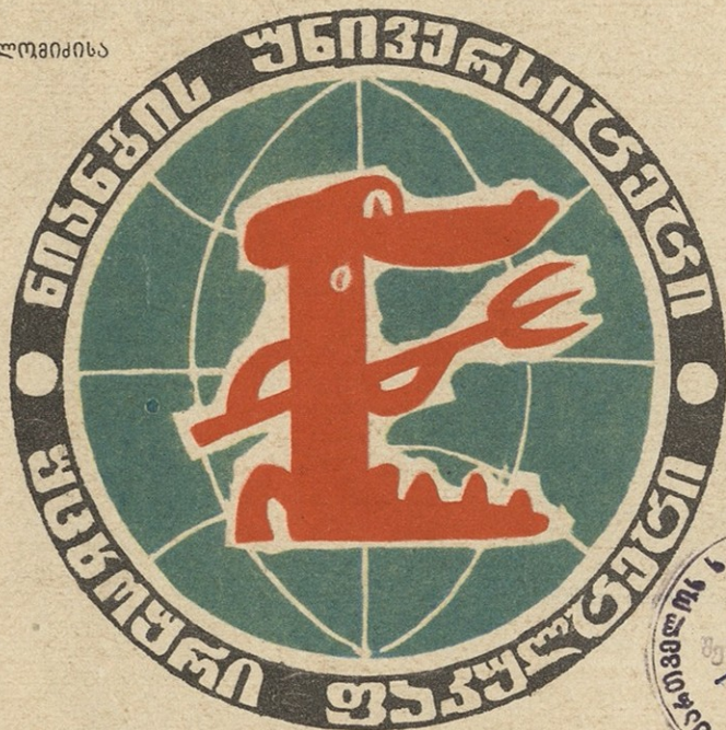
ნახ. ბ. ლომიძისა

საქართველოს მწერთა კავშირი 24673 18.10.73