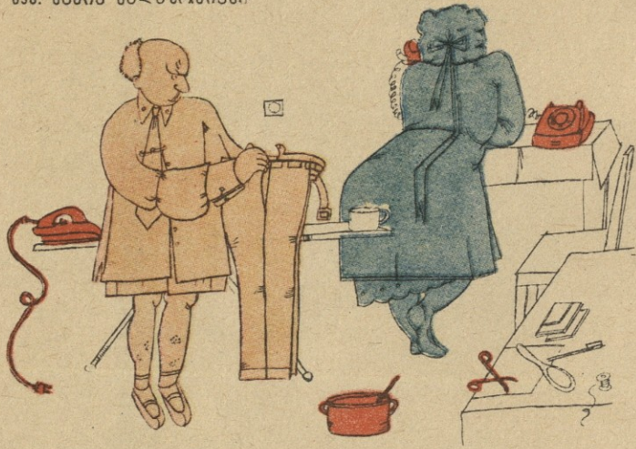
— რაც გიპენტი ჩემი ქმარი გახდა, სულ გატყვევებული დადის, დედამისივითა და, გაუთხოვებელი შარვლით გავიდეს ქუჩაში!