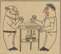
— კაცი, თქალეზე რატომ ოხარებ ხალს? — რა ვინა, თუღე, სიტყვა მთავი, ხალსს თვალითაც არ ვხედავ-გვხედავ!