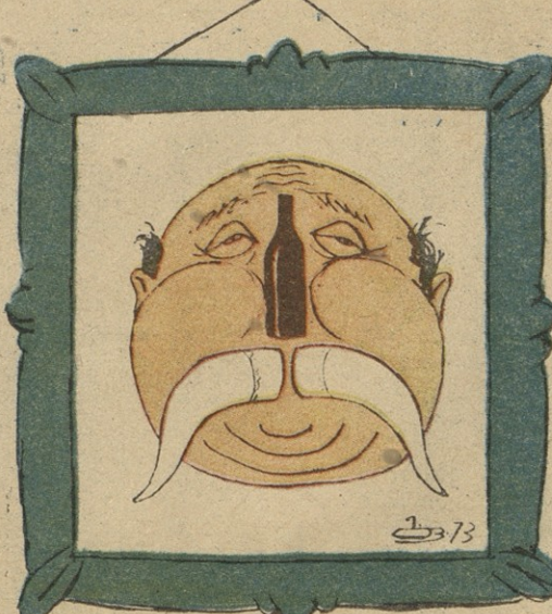
ნახ. ბ. ფირსხალაშვილი