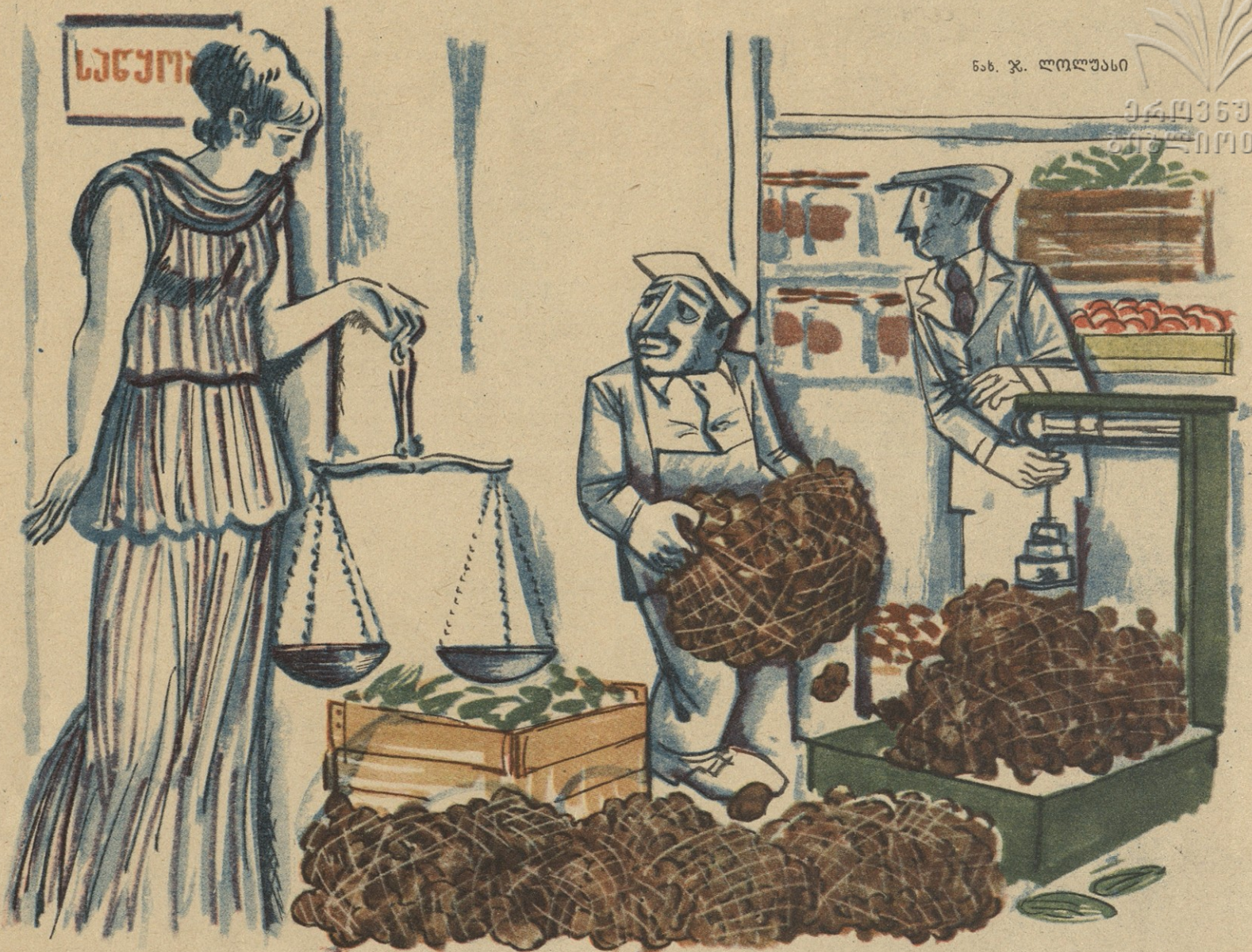
თ მ გ ი ლ ა: გავიგე, ვაჭრობაში ქალებსა და კატიოსან მუშაკებს შეგებნო, კოლა, მეს ჩემი! სასწორით მოვედი!