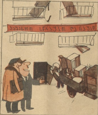
— მშენი, თქალეზე რატომ ოხარებ ხალს? რასადღებ, შობ, იმას თუ დარეულაა იმეორებო!