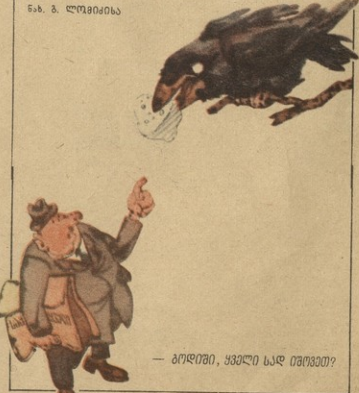
— ბიწოთი, ვხვდი სად ითვით?