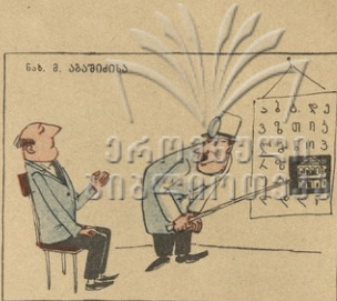
— ბიწო, ამ ქაშაშაზე, ვნადვ-ვნადვო, რის იძიბი, ვნადვ კომინატორება მთრევალზე სასაშუ რის წაშრეხია, იმას რატომ ვერ ხედავ?