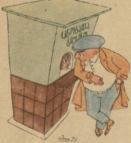
— უხაროს, რა თხაა ჯამბირზე ზვიანო, ხრო ვირ მამაკვი, როდემდის ბაზარულაა ასე?