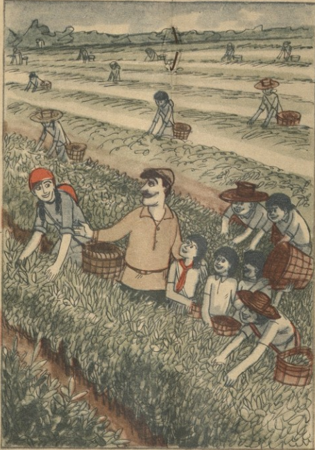
— ბავშვებო, იძირეთ, წაუს ღმირა მატკობა უნდა ვაგებოთ მე-წინავე და ჰველა იმას მთავარად!