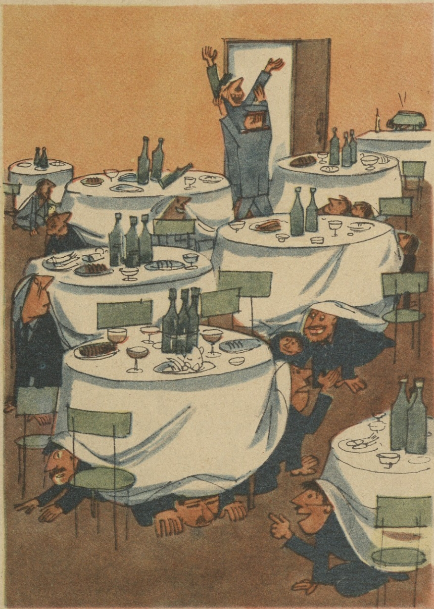
— გონი, წაიყვანეს ის ხულიგანი და აწი შეიძლება გამოეპირათ!