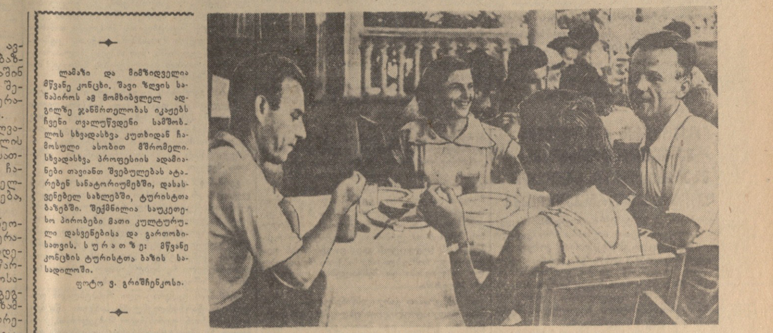
ლაშქი და მიწოდვითი მწვენი კონკი. შავი წილის სახაობის მშენებელი...