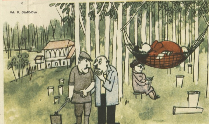
— გველი არ ჩაიბს ამ სრუბოში? — არა, ბატონო! — ახსუს, გელი არ ბრედა? ჩაბა ტყვილად წამოთხვენი სოლის ნათესავენი!