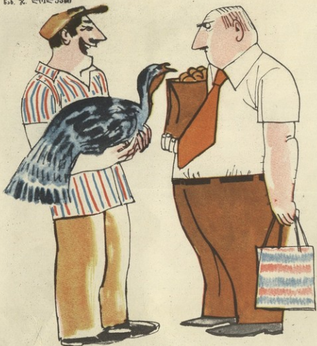
— არა ინდავარში ახლან ფული რიგობო მოვა? — — ფული, თურამ მან სახარაი რეზინი მანინ ფულს მასვს!