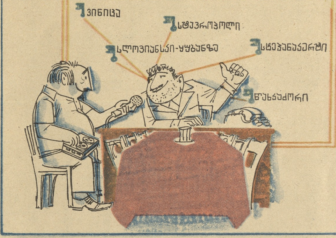
— მიხრო, იქნებ პრტი-ორი რაიონი გაიხსნო კიდე!