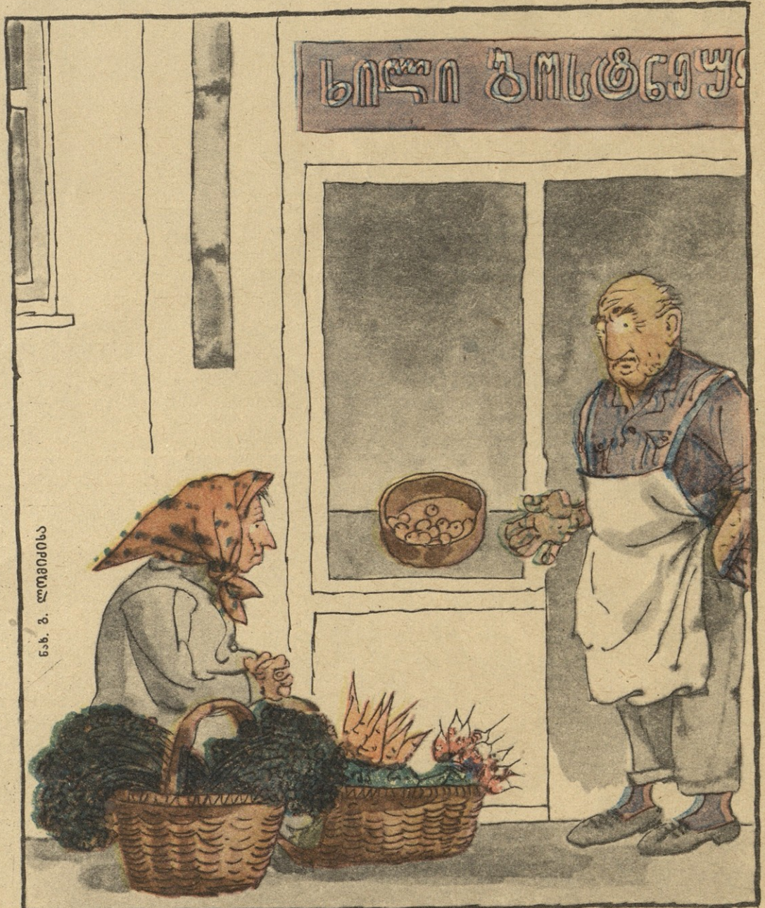
ნ. ბ. ლომიძისა

— დედი! რაღა ჩემი მაღაზიის კარებთან მოიპალათე, ხომ ხედავ, კაცივინი კლარ მუკარება?! —