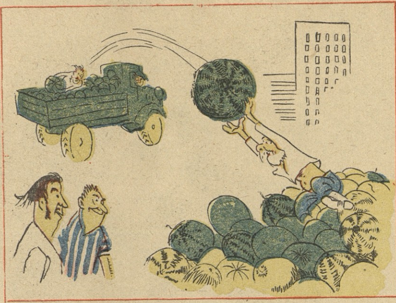
— ე, გიჟო, ვეპარეს რომ ვეპებდით!..