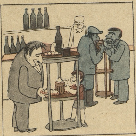
— თავიდან მეს მამედან დავიწყე!..