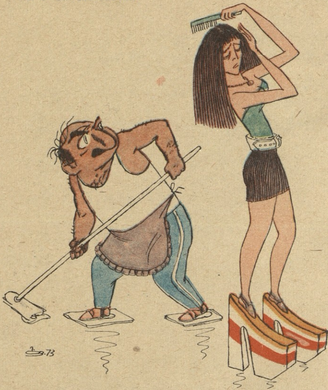
— კიდეც ფულს მთხოვ, ქალო?! არ ამოიყვან- ნო მავ კლავორებიზე, თორემ!