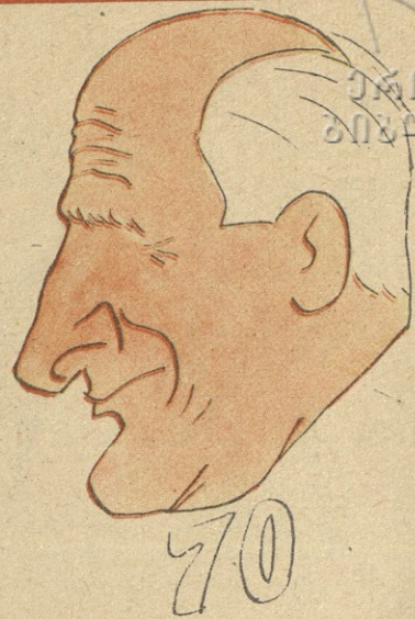
მეგობრული შარტი ბ. ფირცხალაშასი

განვლე გზა ტკივილიანი, ქარიშხლიანი, კლდოვანი! სჯობს შენთან შეკამათებას ღუმილი სახელოვანი! ჯაჭვგაუნდელი მებრძოლო და დაუღლელო ტრიბუნო, მინდა, ასი წლის ასაკშიც, მაგ ენერგიით გიგულო!