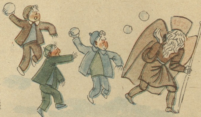
ნ. ბ. ბერიძის მიხედვით

— სადაა დაპირებული საბავშვო ბაზა-გაღები, საორტუ-ლი მოედნები, ბიბლიოთეკები, საბავშვო ფეხსაცმელი?..