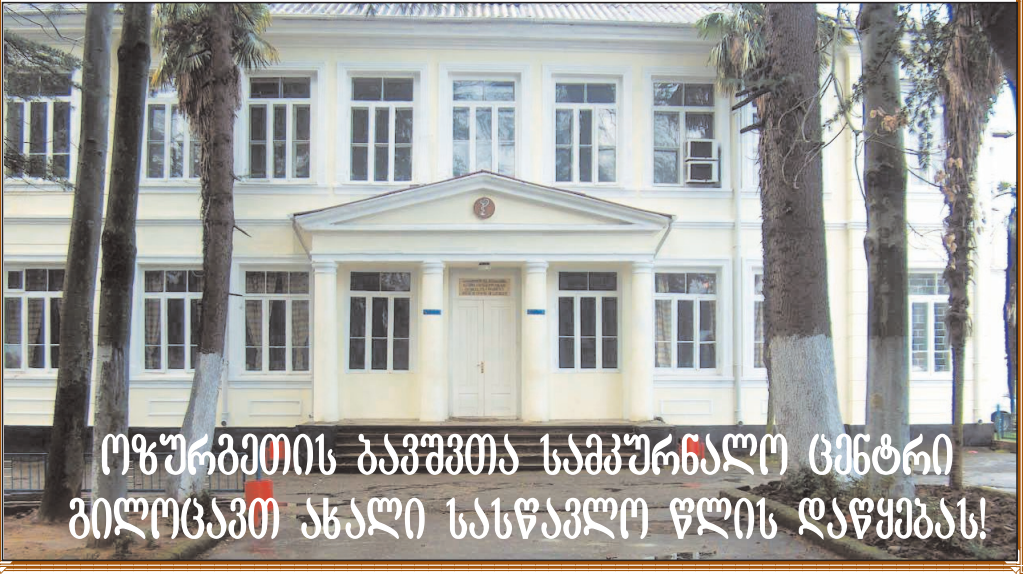
ოზურგეთის ბავშვთა სამკურნალო ცენტრი ბილოცავთ ახალი სასწავლო წლის დაწყებას!

საკრებულოს სოფ. ვაკიჯვარის, ცხემლისხიდის, მთისპირის მაფორტიარი დეპუტატი