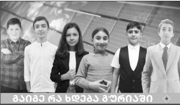
გაიბე რა ხდება გურიანში

სიმართლე გითხრათ, თავიდან არ მეგონა ამხელა გამოხმაურება და ინტერესი თუ ექნებოდა ჩემს წამოწყებას. რამდენიმე დღის წინ 5 წელი გავიდა „TV მეორეს“ დაარსებიდან. 5 წელი არც ისე პატარა დროა, გამოცდილების დასაგროვებლად. მართალია, ტელევიზიაში მიღებულ გამოცდილებას ვერ