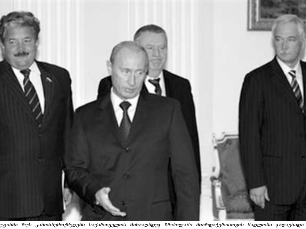
პუტინმა რუს კანონმდებლებს საქართველოს წინააღმდეგ ბრძოლაში მხარდაჭერისთვის მადლობა გადაუხადა

დოქტორი ავალაიანი რუსეთი საქართველოს წინააღმდეგ შემოჭრული სანქციების გაუქმებას არ აპირებს. მეტიც, მოსკოვი ახალ სანქციებზე ფიქრობს. კერძოდ, ოფიციალური მოსკოვი უკვე ემუქრება რუსეთში ქართველ მიგრანტებს და ქართულ ბიზნესს. საქართველოს განადგურება რუსეთმა ლიბისების საქმედ გამოაცხადა და ამ "დიადი მიზნის" გარშემო საზოგადოების მობილიზებას ცდილობს. მოსკოვი საერთაშორისო არენაზეც აქტიურდება, სადაც სულ უფრო არაადექვანური და გაუგებარ განცხადებებს აკეთებს. "სააკრძის რეჟიმი" - რუსული ოფიციალური საქართველოს ხელისუფლებას ყველა საერთაშორისო თავმჯდომარე მხოლოდ ასე მოიხსენიებს.