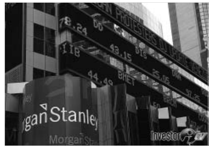
Morgan Stanley-ის მფლობელი Nan Tung Bank-ის მფლობელი

ერთ-ერთმა უმსხვილესმა ამერიკულმა საინვესტიციო ბანკმა Morgan Stanley-იმ ჩინური ბანკის Nan Tung Bank-ის შესყიდვის შესახებ განაცხადა. გარიგების შედეგად, ამერიკული კომპანია ჩინურ საბანკო ბაზარზე თავისუფლად გაეა. ჩინური Nan Tung Bank-ი, რომელსაც მხოლოდ ერთი, 40 კაციანი პერსონალი ემსახურება, ამერიკული Morgan Stanley-ისთვის საბანკო საქმიანობის ლიცენზიებს გაცემს. ამერიკული საინვესტიციო ბანკი კი ფინანსური პროდუქტის შეთავაზების ოფიციალურ უფლებას მიიღებს, რომელიც ნაციონალური ვალუტით იქნება ნომინირებული. ამერიკასთან დადებული გარიგება ჩინეთის საბანკო კომისიამ უკვე მოიწონა. ფინანსური პირობები კი ჯერ არ ხმაურდება.