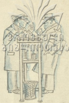
— ჩვენი სახლისპირე ბაქსაშთის მითი სასაში ვამპირენა! ჩვენი ის მითი დღე ვამპირ მითმანესი.

არის კიდევ ერთი საკითხი, რომლის უქმელობა არ შეიძლება: დიდი ხანია თვალსაჩინო ჩანს, თუ რა კარგი შედეგი გამოიღოს საფრთხი მაღაზიებში.