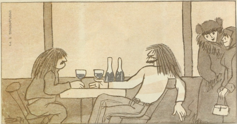
— ახმა უნდა თქვან ჩვენზე, თმბარბოდ და ვამპირებში? —

წელს თბილისს ხილისტენევის მაღაზიები მართლაც რომ სანატორიოდ გადაგადგულენ. მომხმარებელთა უმეტესობა ხელს იბრუნებს და ყურადსაყრად ბაზრისკენ წინწამოძვებით იღებენ. გაფრთხილებული სტეპტიოსი, უფრო კეთილ ფაქტის წინაშე, ვერაფერს აყენებს და, მარწმუნდლთან შედარებით, თითქმის არფერს იფარს ყიფნა-ლომის კარტოფილს, კომბოსტოს, ხახვს და ვაშლს. მხოლოდ კაცლო ჩხრალებს შევსებუბრად, არადა, ოცაპატიანი ისპანახი პრინციპულად თომრებქმნითან საცაზმს თბილივონ.