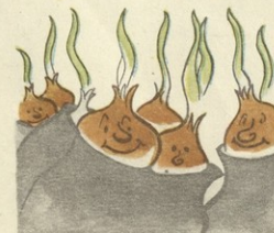
მეტრენობებიც გაიგოს კირანხალი. და, აი, ამ ახალ ლლოს ბაზაში 2250 ტონა კომბოსტოდან თითქმის ნახევარი გაფუძდა და გადიარა, რადგან, ჭერ

ზოგიერთს, მძრალ კითხვებს ეპოციების გამოწვევა არ შეუძლებია. ამა, მოკლებიწინეთი უფრე, მისავლის ათბისი დროს, იყარებენ კირანხლის 10-15 პროცენტზე, ტრანსპორტირების დროს — 10 პროცენტზე, შენახვისას —