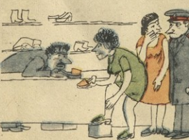
— დასკუქვებოვან ზაღებს ვსახს რომ გეპლუსო ხანაწილ, თუკინი გეპს უნდა მთხოვო: თუ მთხოვო და დათხები, გინა რასს მთხოვებო?