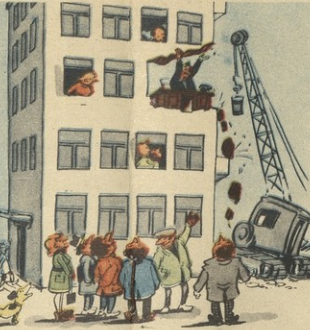
— ეს ახალი პირავრითი ვერ მოხსნის და მისი კაციმებო ნინოვანი მრავალს!