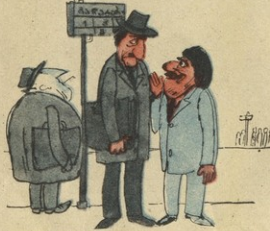
— ღამე რიგში გინდა? — კარგად! რატომ მამოთხები? — მიღობლა გაგებო ფული თუ გინდა!