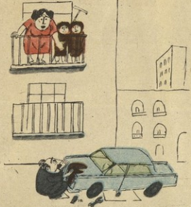
— რაკი მანანს ითხოვ, იატაკს გაწმენდა კარა უნდა, ხეო?