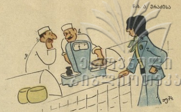
— ბიო, ნუ გუბინია, მაინც ვიპაფრის ხელას!