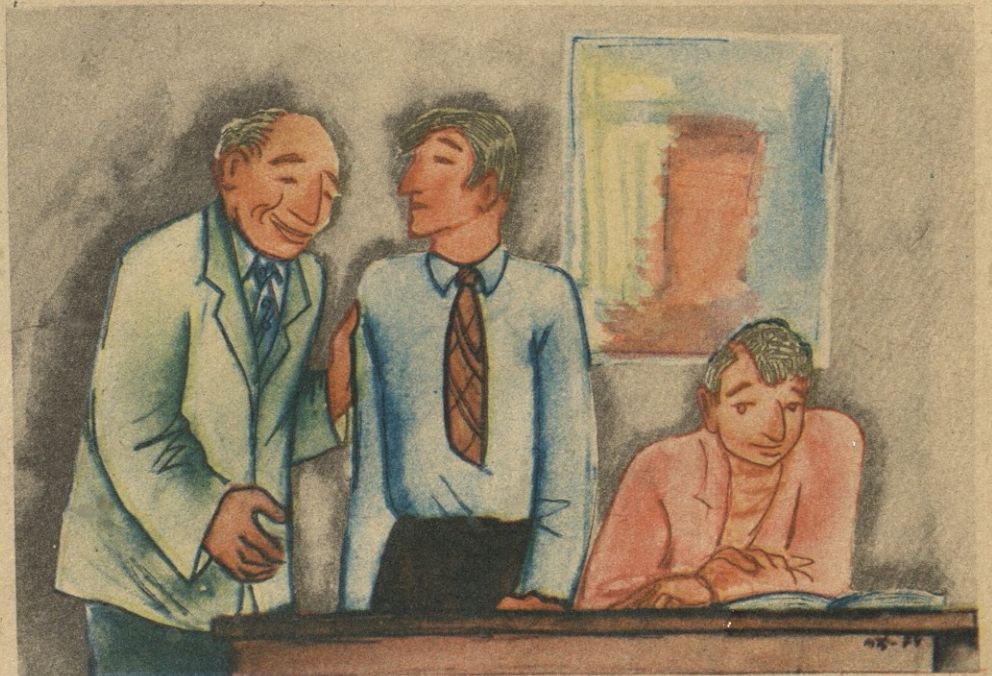
კ რ თ ე ქ ტ ო რ-გ ა მ ო მ ს დ ე ლ ი: აბა კარგად დაფიქრდი და ისე მიპასუხე: რისი ბყაოსანი დაუბრა შოთა რუსთაველმა?