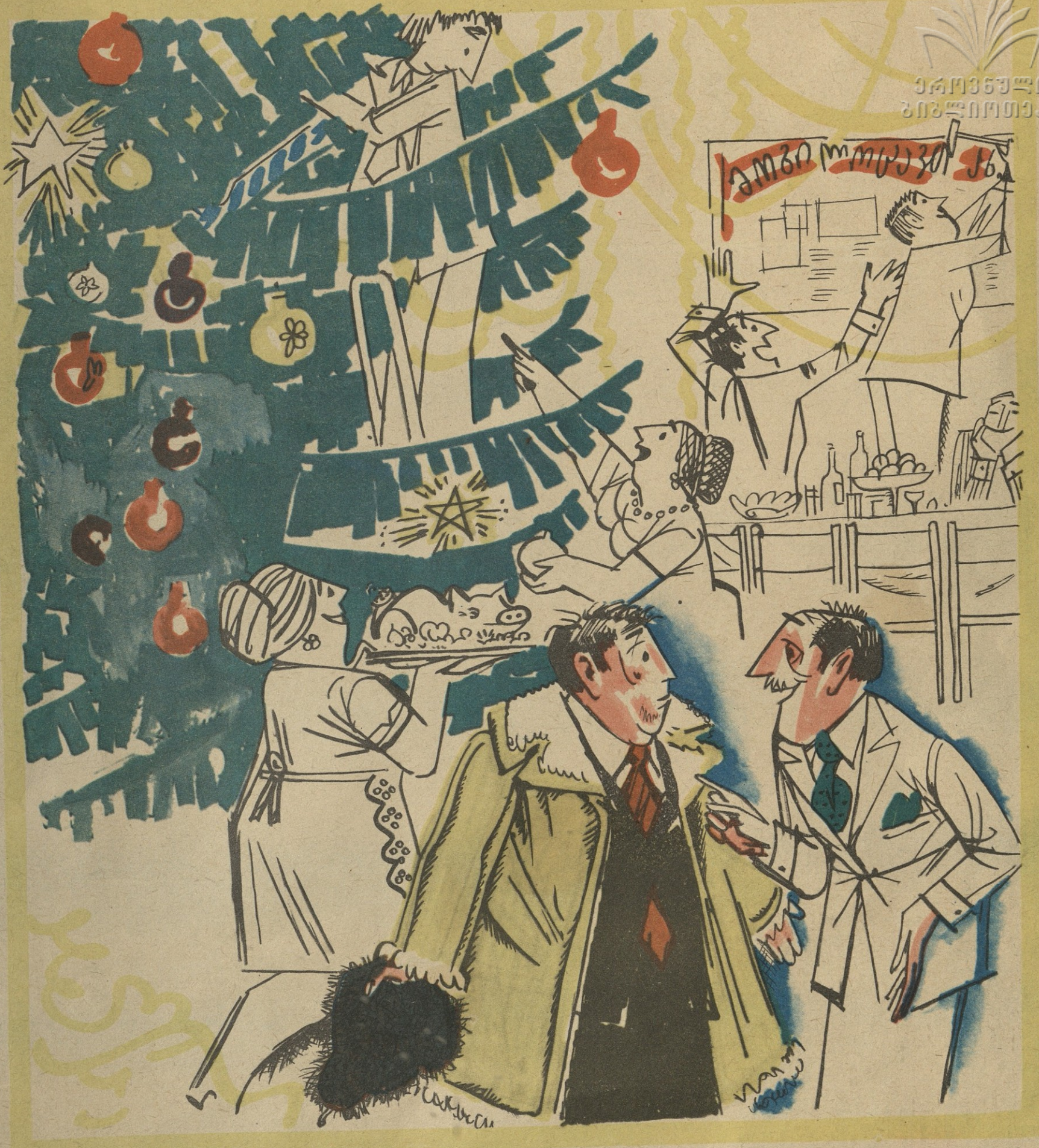
— მთელი ქალაქი მოვიარეთ და თოვლის ბაბუა ვერსად ვიპოვეთ!.. — ჯადით სოფელში, იმ მარტო ბაბუებზე დარჩენილი!