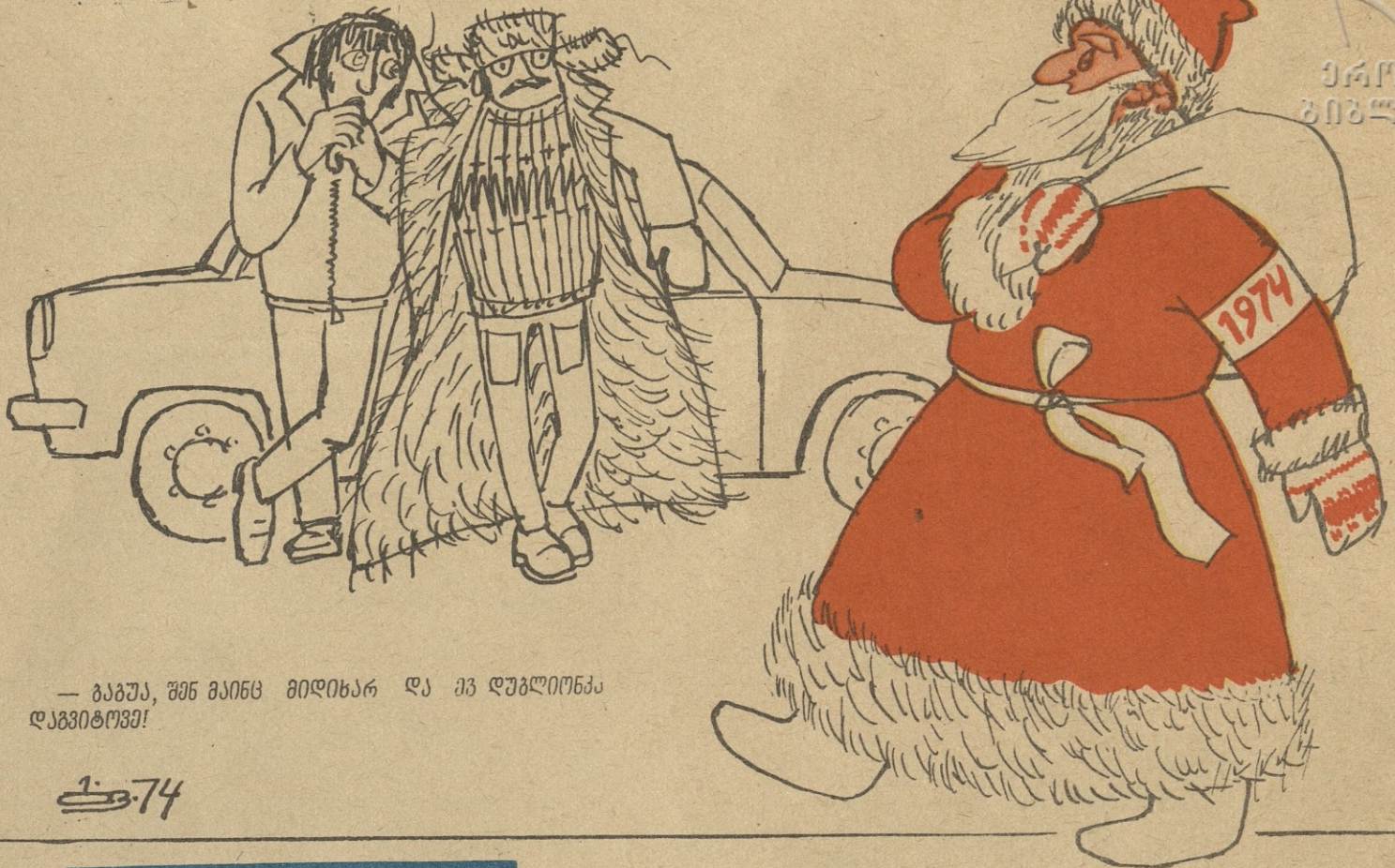
— ბაბუა, შენ მაინც მიდიხარ და კვ დუბლირება დაგვიტოვე!