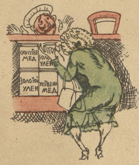
— სად გაქრა, ბიჭო, ნატურალური თაფლი? — რაც ქართულმა ფუტკარმა ორი ოქროს დიდი მელაღი მიიღო, გახარმაყდა!