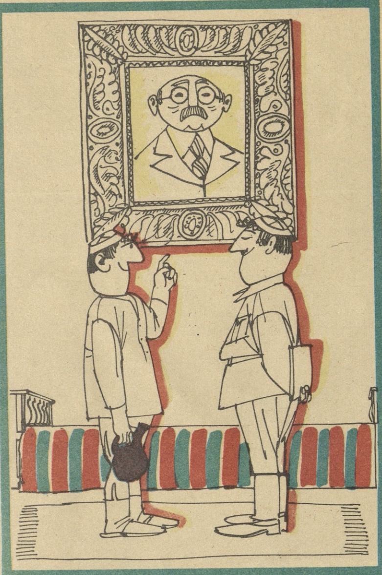
— ეს ვინი სურათი გაგიკრავს კედელზე? — ამ კაცმა დიდი სიკეთე მიყო, შვილი ჩამიჭრა და სოფელში დაიბრუნა.