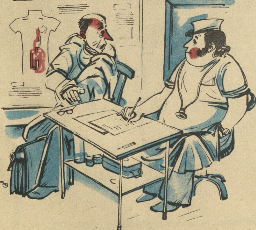
— ჩემი ანკეპა ხომ შავსაქვით, ექიმო, ახლა იპვენ მითხარით, რომელ წელს დაემთავრეთ ინსტიტუტი?

თავდაპირველად მინდა გავაცნოთ ადამიანთა მეტყველების თავისებურება. მაგალითად, თქვენ არ იცით, რას ნიშნავს „ხილბოსტანვაჭრობა“. კურდღლები ძალიან დაინტერესდებიან, რომ ესმოდეთ ამ ბრძნული სიტყვის შინაარსი. ასეთივე სიტყვაა „თბილქალაქნობა“. აქ მოდიან ადამიანები და ლებულობენ ცნობებს ადამიანების შესახებ. „თბილქალაქნობა“ იტყობინება, რომ ამა თუ ამ ადამიანს სურვილი აქვს გაუცვილოს ამა თუ იმ ადამიანს ერთი სამოთახიანი ბინა ორ ერთოთახიან და ოროთახიან ბინებზე მაინცდამაინც სხვადასხვა რაიონში. ეს ხდება ხოლმე მაშინ, როცა ცოლ-ქმარი გაიყრება. თქვენ არ იცით, რას ნიშნავს ცოლ-ქმარი? წარმოიდგინეთ ორი ქათამი — მამალი და დედალი. ხდება ხოლმე, რომ მამალი უფრო დედალი გამოდგება, ან, პირიქით, და მაშინ ამბობენ, რომ ცოლ-ქმარი ერთმანეთს ვერ ეწყობა. „თბილქა-