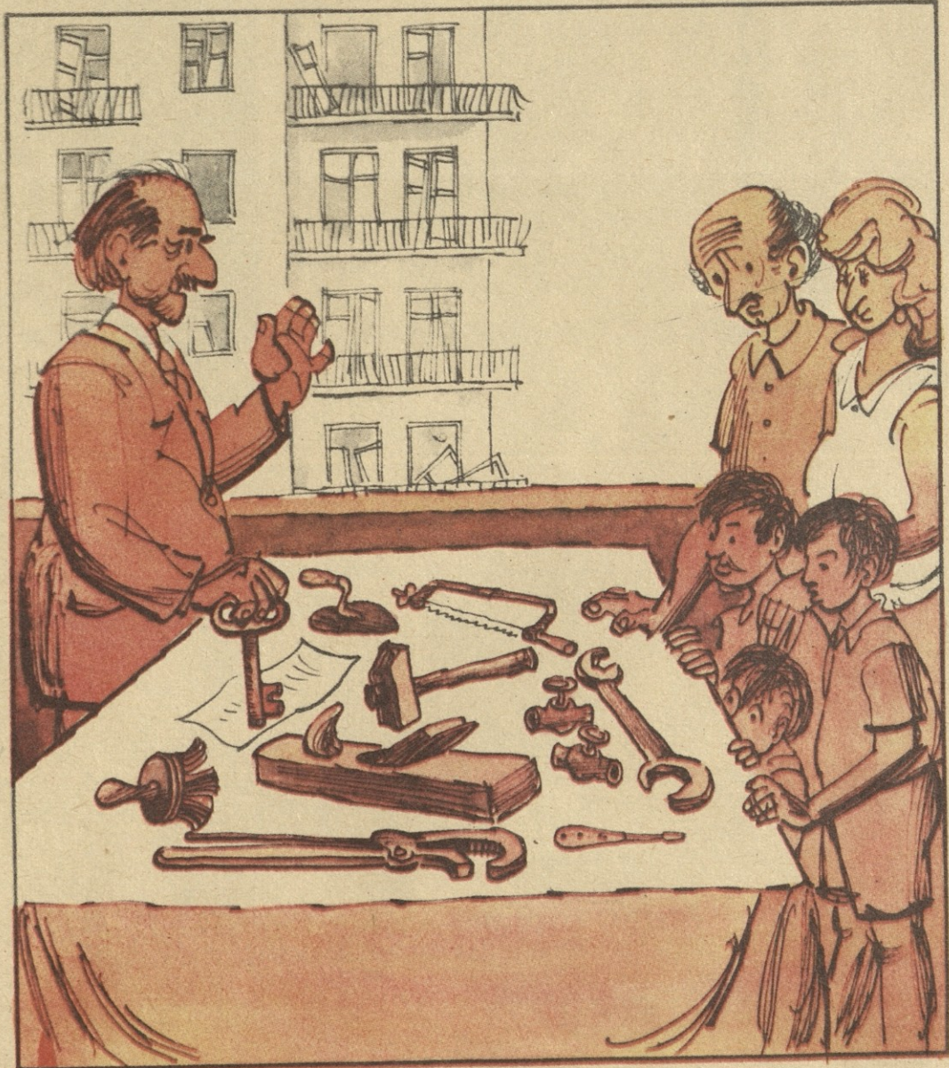
— აი, ორდერი, გასაღები და ხელსაწყო-იარაღები, რაც ახალ ბინაში დაგჭირდება.

— ეხ... — თქვა აქეთამ. — ეეხ... — თქვა იქითამ. — რას კითხულობთ ასე გატაცებით, კოლეგავ? — Главное описание чувства, потом уже нравов... — ამოიკითხა აქეთამ და „ეეხ“ დააყოლა ქართულად. — ეხ, ეხ... გრძნობები... ეკზიუპერი! — ხმამაღლა თქვა იქითამ და ცალი თვალთ მალდა აიხედა. — არა, მარკ ავრელიუს! — წამოიძახა აქეთამ და იმანაც მალდა აიხედა. — მარკ!.. მარკ ერიხა? — ერიხა მარია... ანა ბაუესტვენა! მხოლოდ ცოტათი მძიმედ იკითხება. — გააჩნია ვის მიერაა თარგმნილი. — მე ორიგინალს ვგულისხმობ. — ზოგიერთ ორიგინალს თარგმანი გერჩიოთ. — ეს აფსურდია. — თქვა იქითამ და ზემოთ აიხედა.