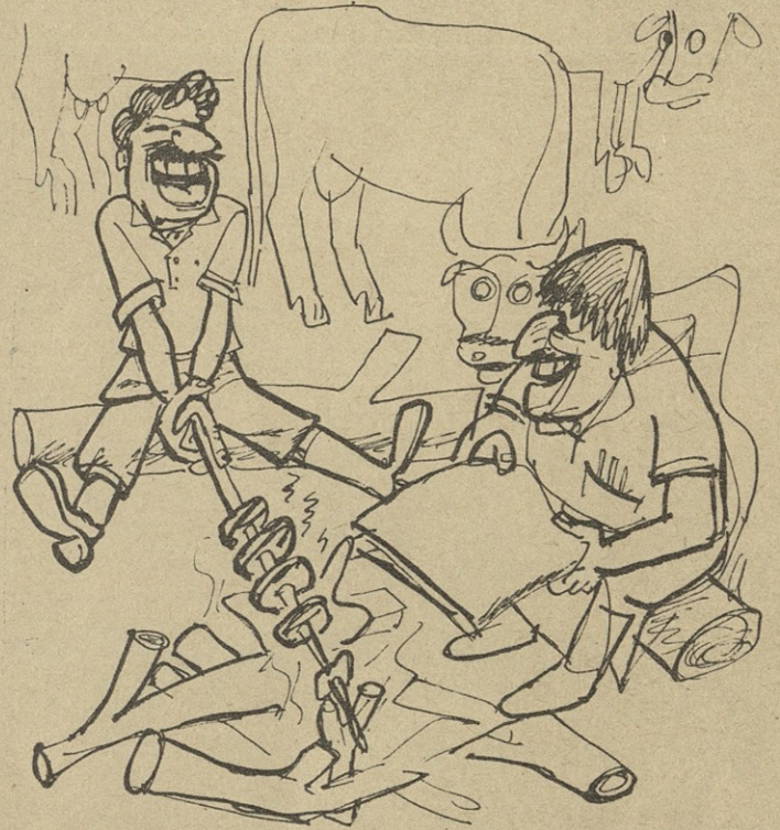
— ამათი განვითარების გულისთვის, ძმაო, მე შვჰადის ჰამას ვერ გაღავეჩვევი!..

— ვოწლე ატკრიტის ოკონ ვეშჩი ნე კლადიწვი! ნა ღობისი ვარავსტვო! — ამის შემდეგ ფანჯარა საიმედოდ ჩაკეტეთ და, კარცერში გამოშვებული დედასავე, ძილს მივეცი თავი.