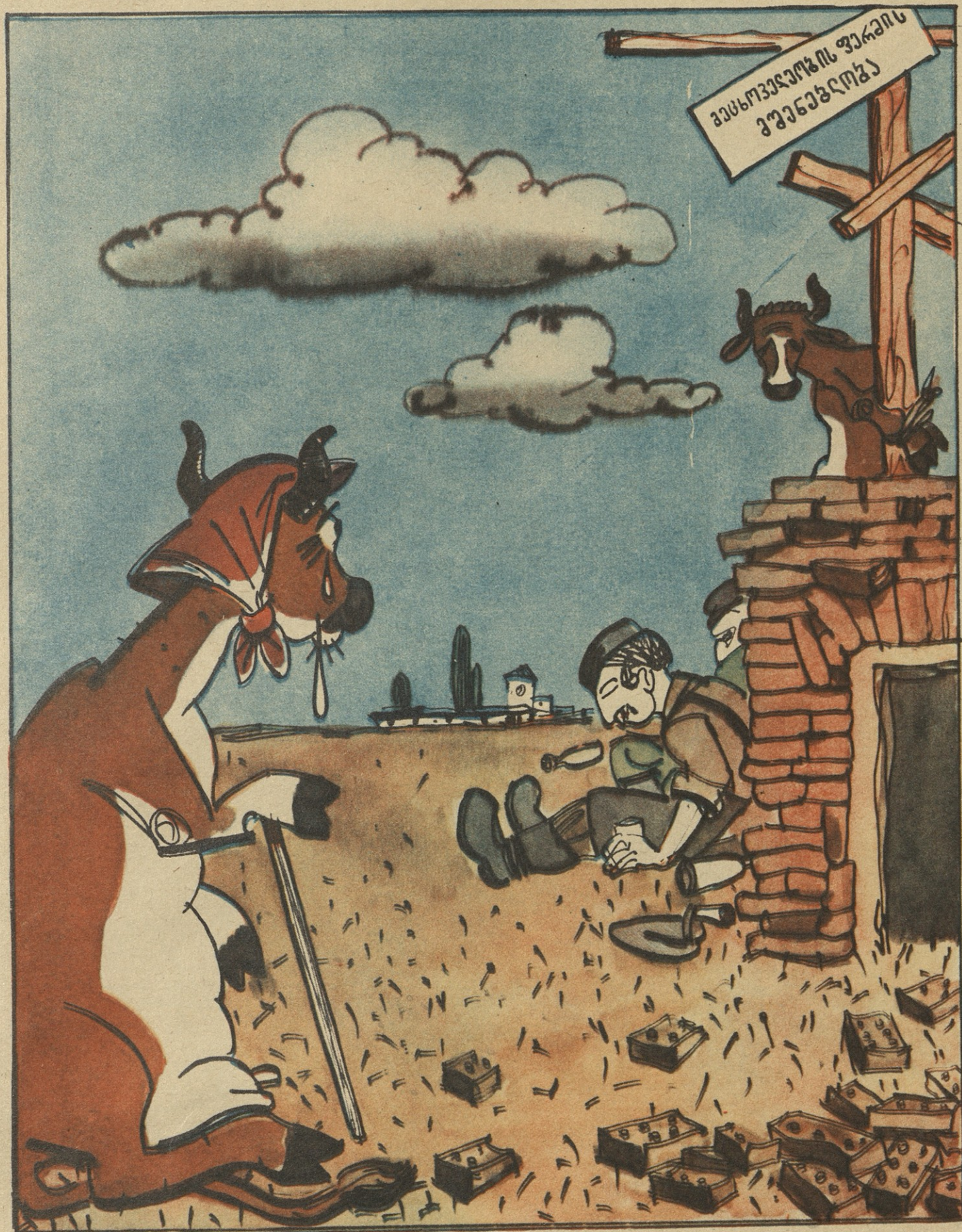
ნახ. გ. ლომიძისა

სერიოზულად უნდა ვუსაყვედუროთ ჩვენს სამშენებლო და სამონტაჟო ორგანიზაციებს, რომლებიც აჭიანურებენ მეცხოვედების ობიექტების მშენებლობის დამთავრებასა და საქსპლუტაციოდ დროულად გადაცემას. საგარემოს კვ. ცკ-ის XVIII პლენუმის მასალებიდან.