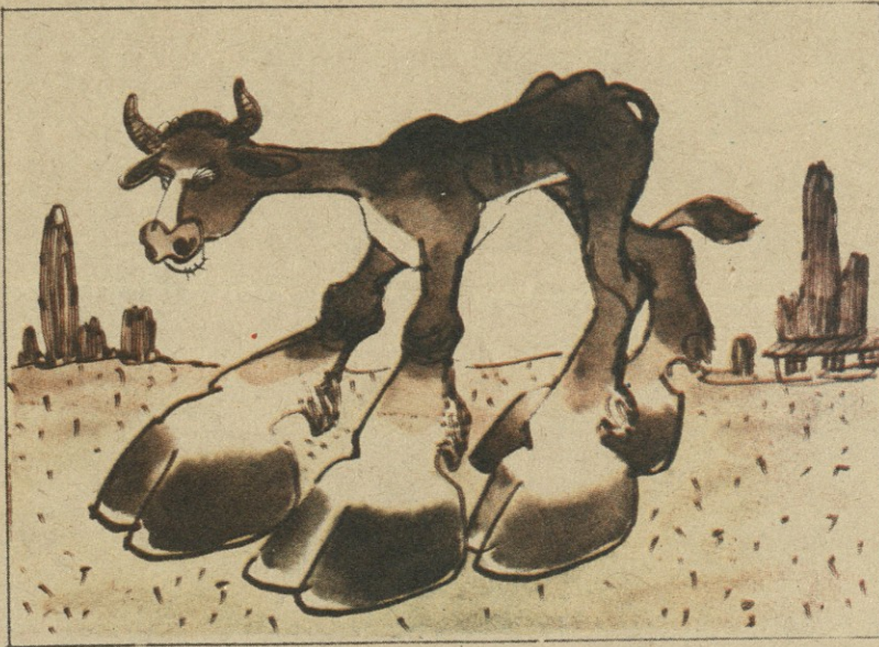
მსხვილფეხა საქონელი ზოგიერთი „სპეციალისტის“ წარმოდგენით