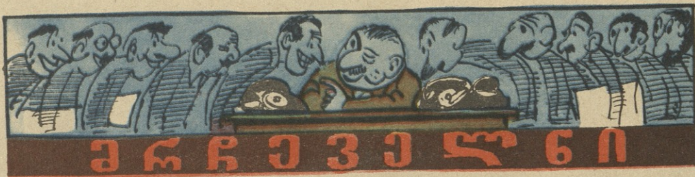
(პიესა — პერპეტუუმ მობილე)

— ჩქარა, ფული! ჩაის სერვიზი იყიდება ოცდამოთხ კაცზე! — ისეთი ქართული შვპარსხვინე, ოცდამოთხ კაცს ჩაიშ რომ დაკაბიშვებს!