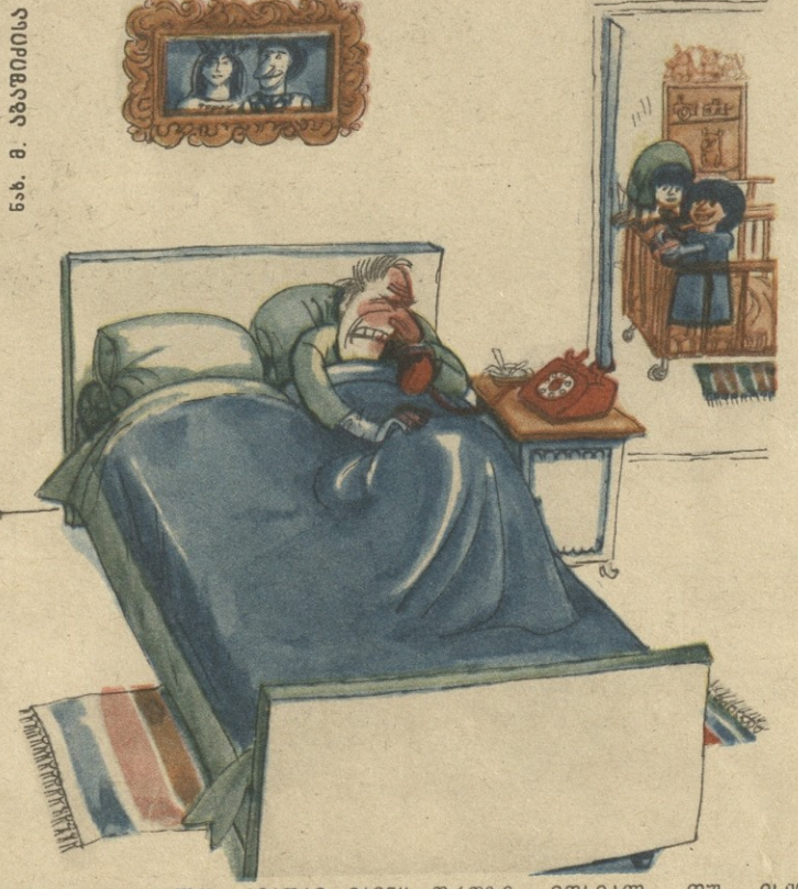
— ქალო, ამაღამ მაინც დროზე მოხვალ, თუ ისე გაბრძანდება თათბირი?!