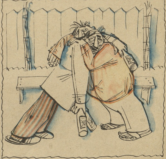
ნახ. ჯ. ლოლუასი

თბილისიდან თემქის დასახლების III მიკრორაიონის V კვარტალის 14-ა და 14-ბ კორპუსების მცხოვრებნი, თავიანთ წერილში, ბინის უხარისხობას გულისტკივილით აღნიშნავდნენ. რედაქციამ წერილი ლენინის რაისაბჭოს აღმასკომს გადაუგზავნა. აღმასკომმა გვიპასუხა: „...14-ა და 14-ბ კორპუსები საუწყებოა და ეკუთვნის გეოლოგიურ სამმართველოს. შემოწმებით ფაქტები დადასტურდა და დადგინდა, რომ აღნიშნული კორპუსები ექსპლოატაციაში შევიდა მთელი რიგი სამშენებლო დეფექტებით.“ ...ჩვენს მიერ აღნიშნული დეფექტების სასწრაფოდ მოსაწესრიგებლად საკითხი დაისვა გეოლოგიურ სამმართველოს წინაშე.“ ამასვე ამბობენ, თემქის დასახლების III მიკრორაიონში კერ რადიოც არ გაუყვანიათ, მიუხედავად იმისა, რომ საკითხის შესახებ ერთხელაც იყო ლაპარაკი.