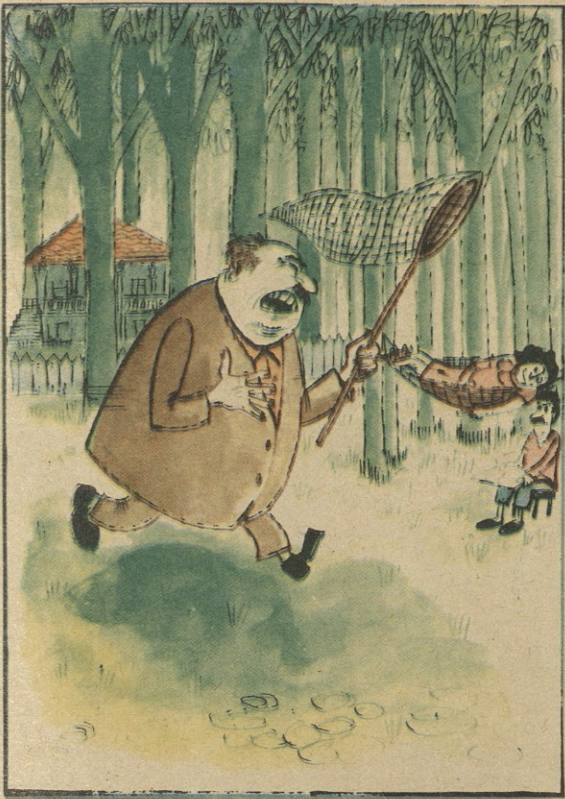
— რა დაეპყა ამ სწყალმა, ეიბს, დასვენების მაგივრად, სირობილი რომ დაუნინავს? — იმდენი შუუჭამია, რომ ვეღარ ინეღმება!