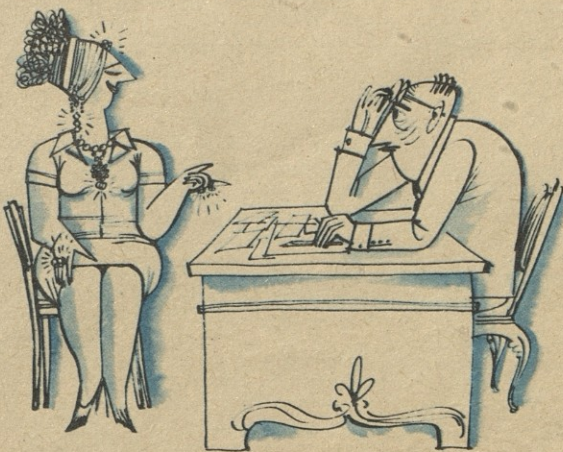
ნახ. 8. ლოლუასი

— კატისცემულ პროფესორო! თვითღირებულეაზე ნურავმარს შემეპითხებით და დანარჩენი, რაც ბინდათ, გკითხეთ!