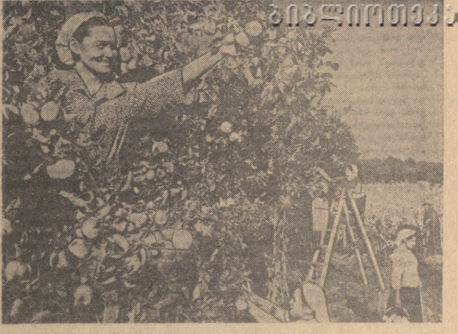
ბოლის კრეფა სტალინის რაიონის სოფელ არცივის კომმუნისტურმა...