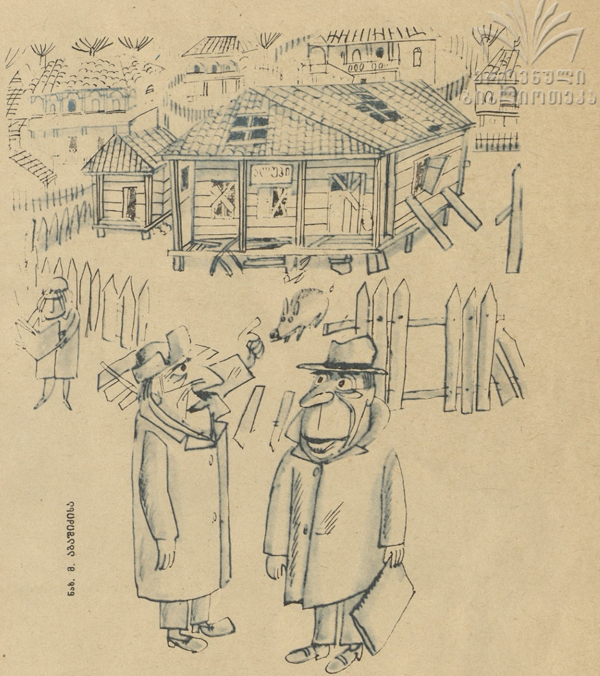
ნახ. მ. აბაშიანი