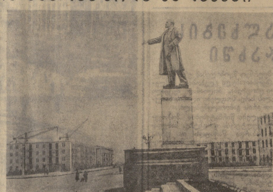
ლენინის სახელობის მოედანი სუბგაიში.