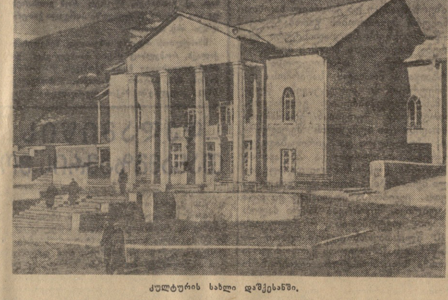
ქალტუბის სახლი დაშესანში.