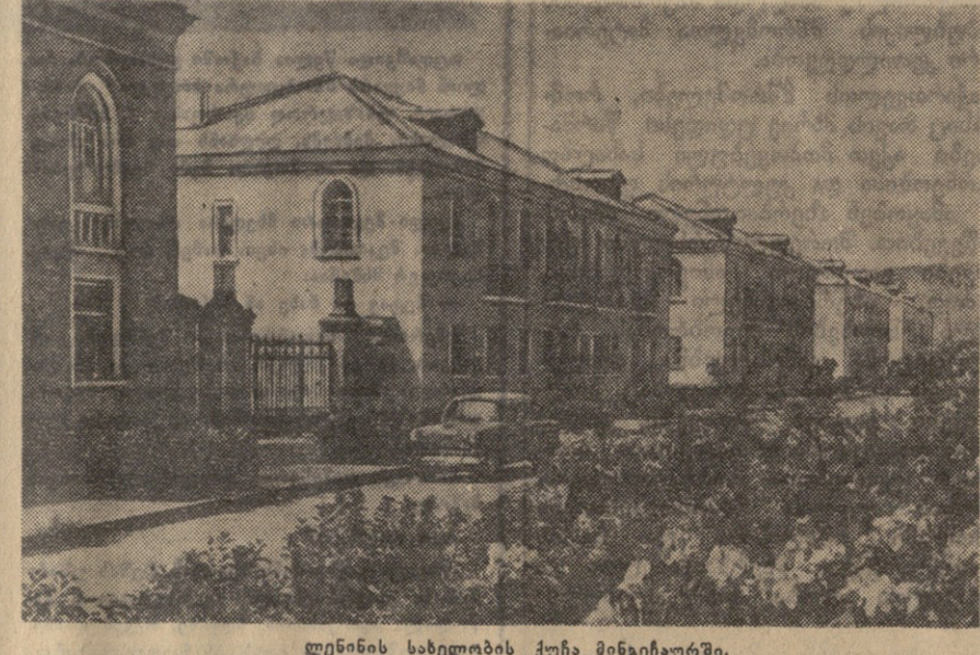
ლენინის სახელობის ქუჩა მინგაჩაურში.