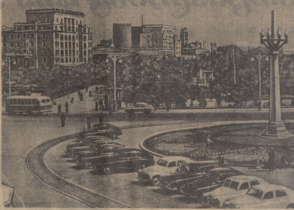
ოცდახუთი წელია საქმი ვიცავთ...