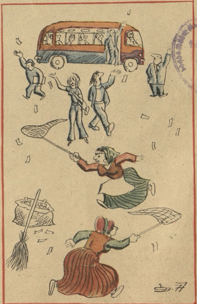
ნახ. ბ. ზირცხალაშვილი