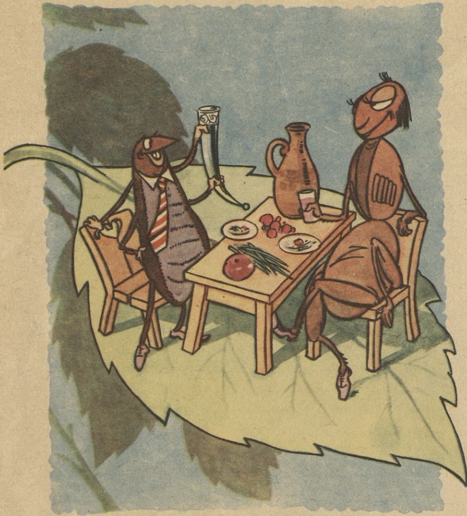
— ეს იმ ღორს გაუმარჯოს, ჯაგარს რომ მოგვამს და რძოს არ მოგვთხოვს!..