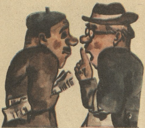
— რამ შევაშინა, ვე ყარადი კი არა, ჩვენი სახლმმართველობის სანტექნიკოსია!