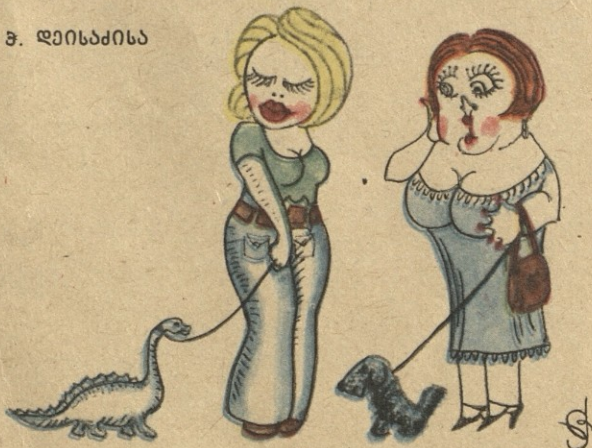
— რა მშვენიერია, საიდანა? — ჩემი მშულე არქეოლოგია.