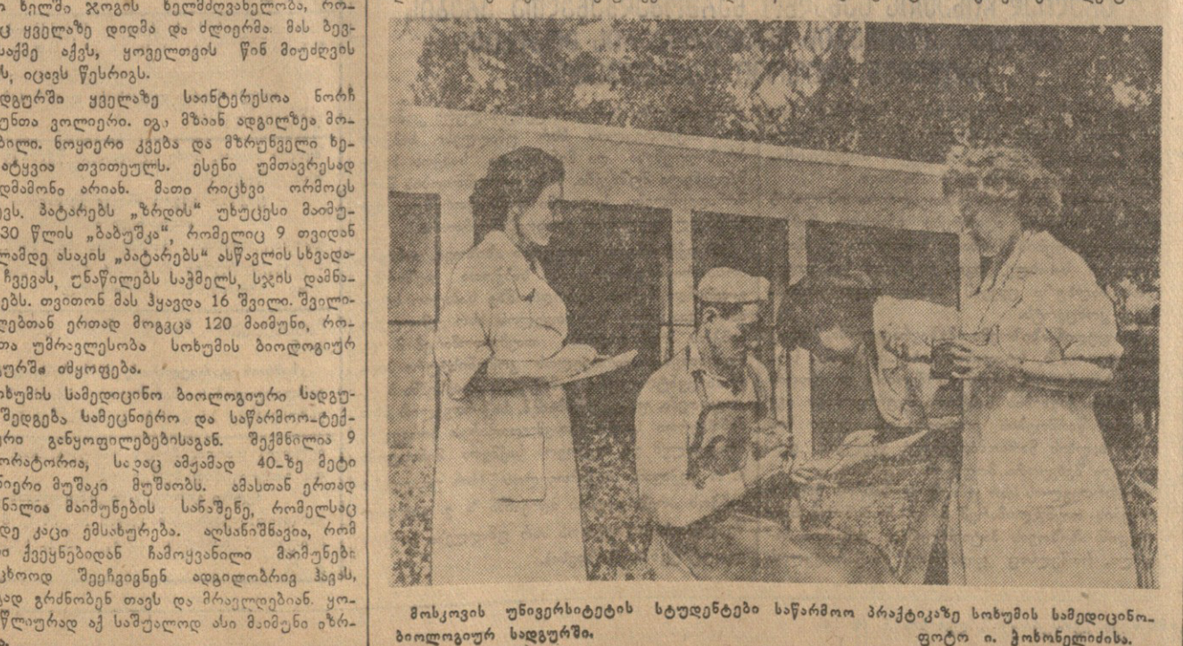
სოხუმის უნივერსიტეტის სტუდენტები საწარმო პრაქტიკაზე სოხუმის სამედიცინო-ბიოლოგიურ სადგურში.