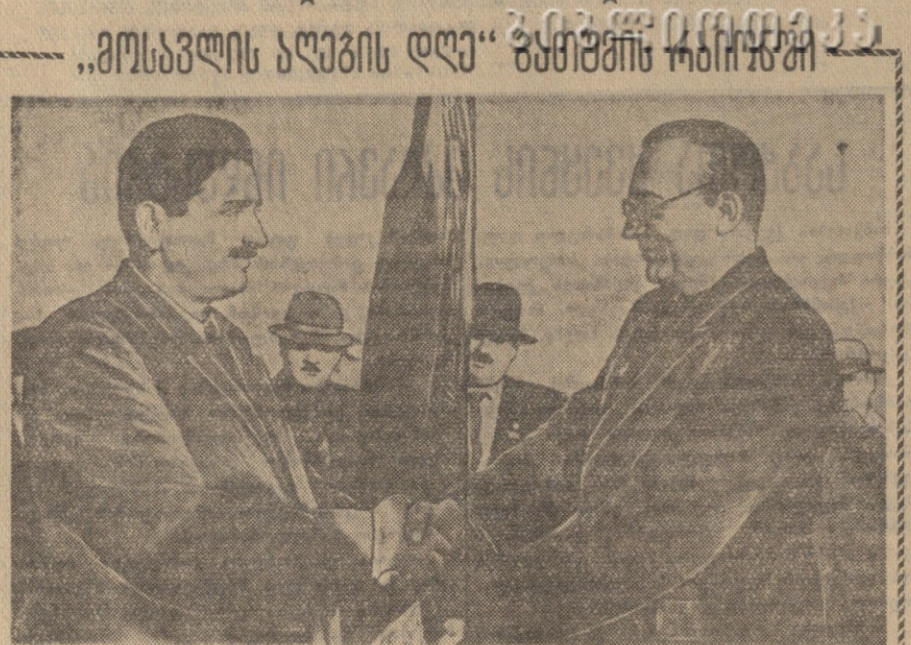
მთელ საბჭოთა ხალხთან ერთად დიდი შრომითი და პოლიტიკური აღმაშენებლის გზაზე წინსვლაში მნიშვნელოვანი როლი უკავია მრეწველობის განვითარებისათვის. მნიშვნელოვანი წილი უკავია მრეწველობის განვითარებას. მნიშვნელოვანი წილი უკავია მრეწველობის განვითარებას.

აქვეის ჩაის ფაბრიკის კოლექტივი, რომელიც ოქტომბრის რევოლუციის მე-40 წლისთავის დღესასწაულად შეხვედრისათვის სოციალისტურ შეჯიბრებაში ჩაბმული ონპარის ჩაის ფაბრიკის კოლექტივთან, სასაბჭოთაო წარმატებით ზღვება დასაწაფულს. შრომის სწორი ორგანიზაციის, ტექნოლოგიური პროცესების მართვით და ცივის, ახალი ტექნიკის ფართოდ დანერგვის შედეგად ფაბრიკის კოლექტივმა 10 დღით ადრე — 20 სექტემბრისათვის შეასრულა ჩაის მწვანე ფოთლის დამზადების წლიური გეგმა. უმაღლესი ხარისხის მზა ნაწარმის გამოშვების წლიური დაგეგმვა შესრულებულია 18 დღით ადრე, გეგმის გადახვედრით ნა-ცვალად 261 ტონისა გამოშვებულია 280 ტონა უმაღლესი ხარისხის, ჩაი — „საქართველოს თიავალი“ „ექსტრა“, „უმაღლესი ხარისხის“, „პირველი ხარისხის“.