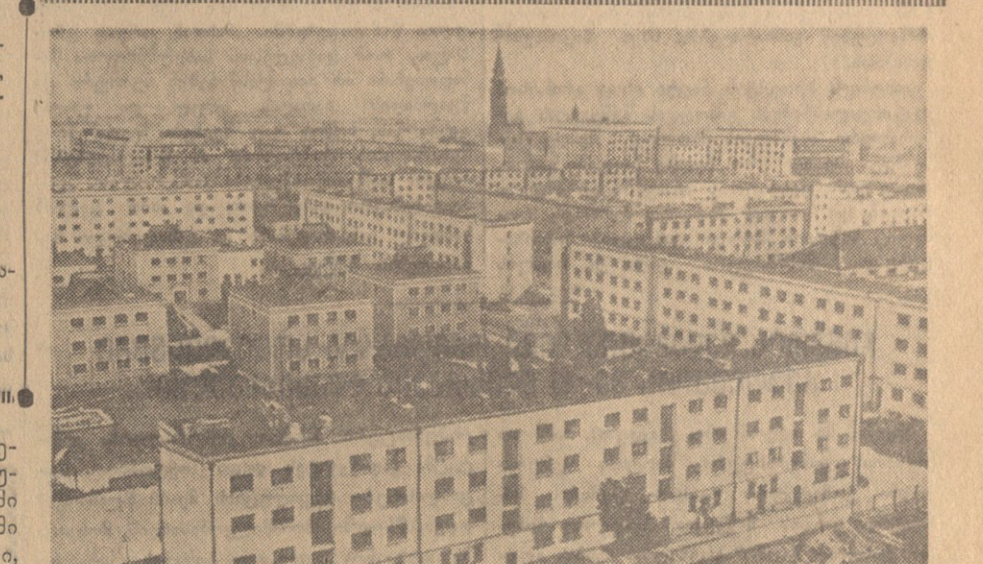
გარშავა პოლიტიკის სახალხო რესპუბლიკის საბჭოს რეგულირების სატყეო მრავალპარტიის, სატყეო მრავალპარტიის სამმართველო მრავალპარტიის და ნაგებობის დარგში.