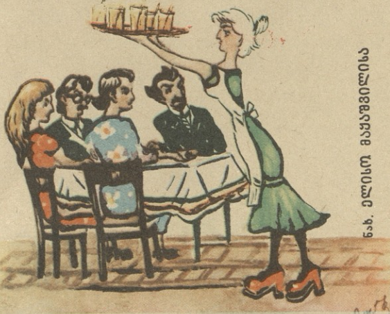
ნ.ბ. ელისო მაჰარაშვილისა