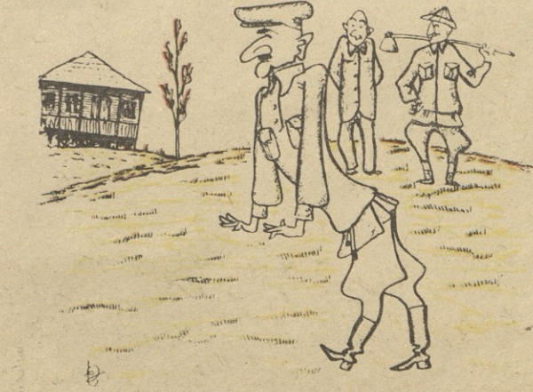
ნ.ბ. ზ. დვისაძისა

— ამ ბოლო დროს რაღაც სხვანაირად დადის მირილი! — ქვიფი ყანფი ვადასდენია და, აბა, რა ანას?