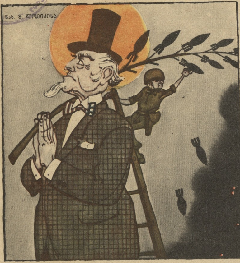
ნ. ს. ლაზარევიჩისა

7-78 ამერიკის შეერთებულ შტატებს თავი მოაქვს, როგორც მშვიდობის მძიებელს ახლოაღმოსავლეთში. ეს მაშინ, როდესაც ისრაელი ამერიკიდან მიღებული იარაღით ანადგურებს ლიბანის სოფლებსა და ქალაქებს.