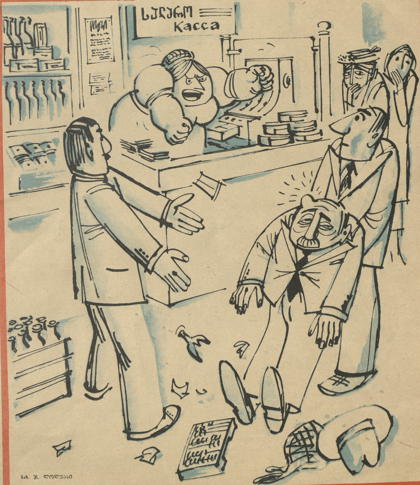
ხაზ. ჯ. ლოლუასი

— ახლა მაინც მივცით შაურისანი, კოვზი დაიღვას!