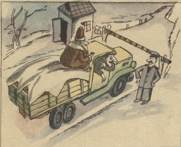
— როგორ, არა გჯერა, თოვლის ბაბუა რომ არის?!