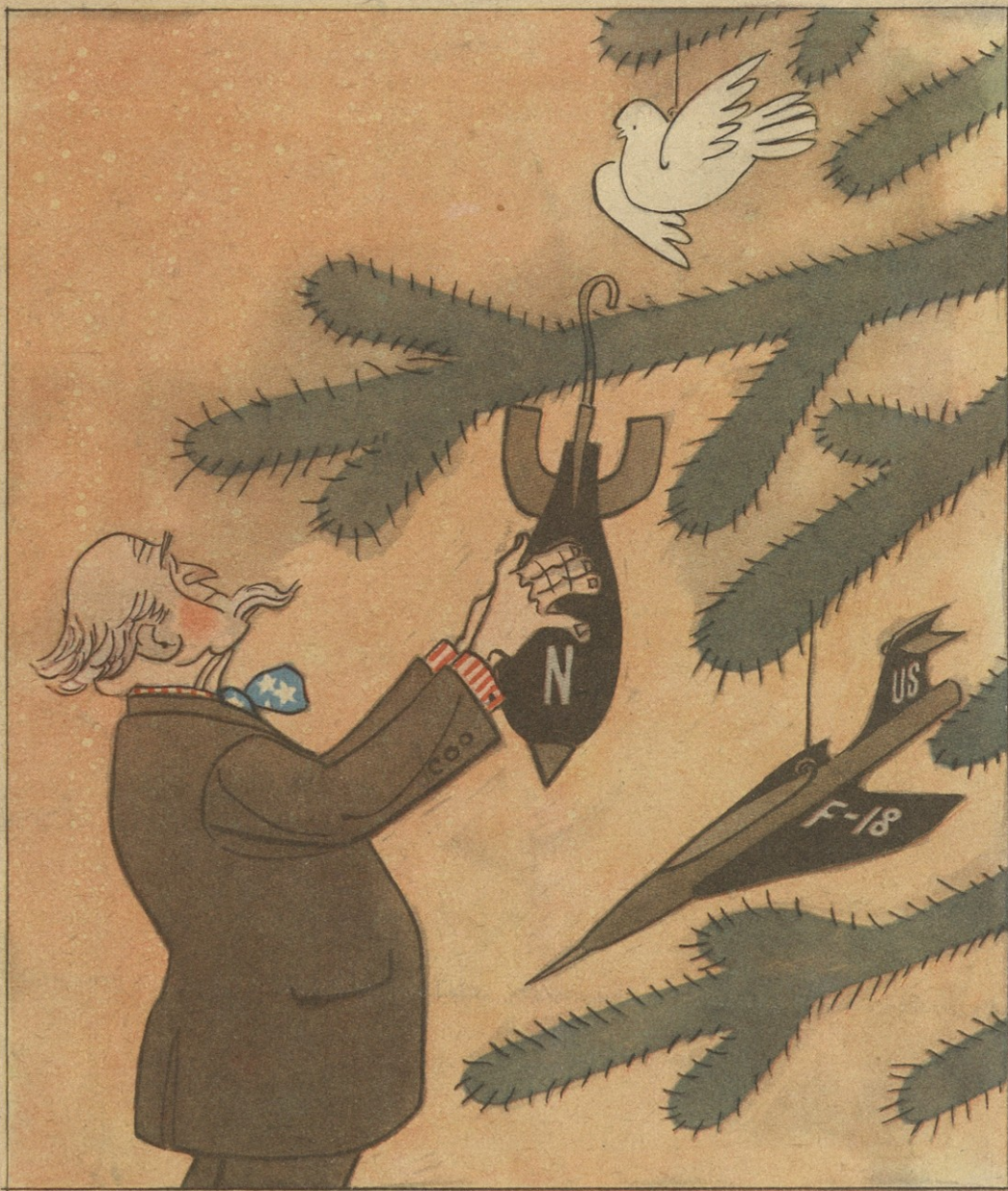
ამერიკის ადმინისტრაციის ნაძვის ხე