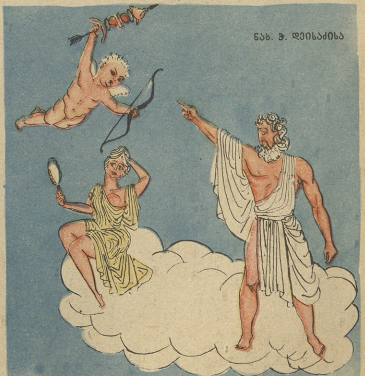
ნახ. 3. ღვინოსაძისა

— ეს გავფიქრე მენ ბაჟუჭუ: ჯერ სასიყვარულო ამბავში ბარბე და ახლა ქორწილებშიც დაიწყო სიარული!