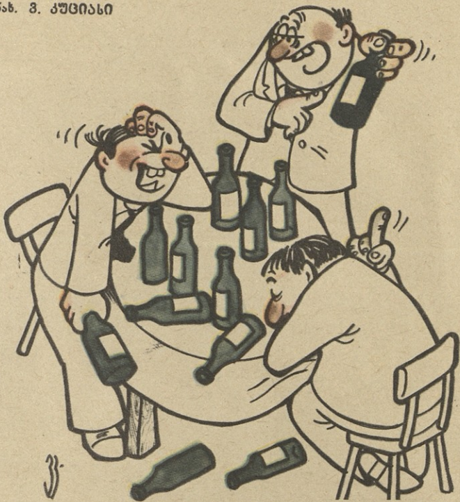
ერთიც დავლიოთ და ზუსტად 12 იქნება!