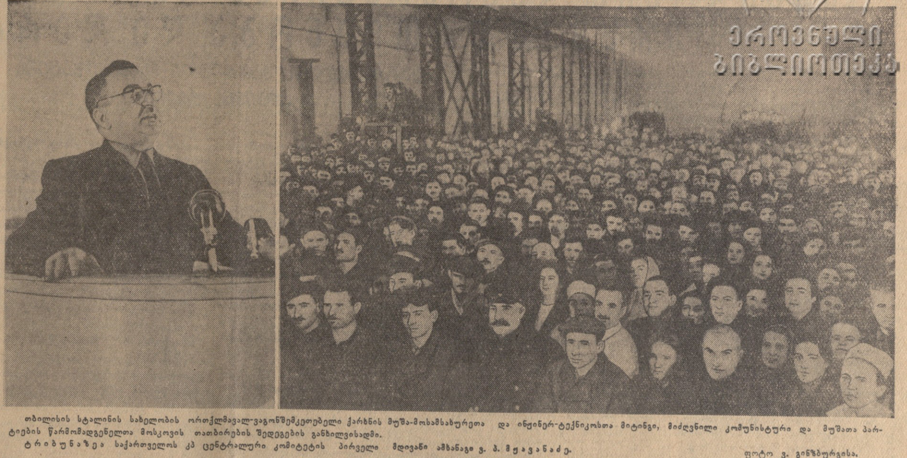
თბილისის სტალინის სახელობის ორთქლავა-ვაგონმშენებელი ქარხნის მუშა-მასშტაბურმა და ინჟინერ-ტექნიკოსმა მიტინგი, მიმდინარე კომუნისტური და მუშათა პარტიების წარმომადგენელთა მოსკოვის თათბირის შედეგების განხილვისას...