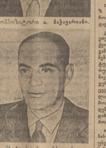
კომპოზიტორი ა. მუჰაჯირიანი.

ტამედ ამდღივებს, აღწრნებს და აძლიერებს მუსიკალურ იერსახეებს. მოკვითი, მოზომილი და აზრის მომტანი რიტმული მუსიკალური და ქორეოგრაფიული მელიდია წარმართავს მთელ სპექტაკლს, რომელიც მშობლიური ქართული ბეგრებით ფრთხისა შლიან; ზოგან სპეციფიკო, ზოგან ხორუმის, მაგრამ ისე განზოგადებულია, რომ მათ უკვე ვერც უნორგრაფიული ხასიათი ეკარგებათ და საერთო, საკაცობრიო, ყველასთვის გასაგებ მუსიკალურ თხრობის ენა იქცევა. შვერი, მუსიკალურად მშვენიერი, ძალიან ბეგრადივი ვახტანგმა, ბეგრი ისეთი, რომელიც კომპოზიტორ ა. მუჰაჯირიანის მაღალი ნიჭის პარაქაზე დალადებს. ბეგრი ქორეოგრაფიული სურათი თვალწინ გვიტრიალებს, ბეგრი ისეთი, რომელთა წყალობით ვახტანგ ჭაბუკიანის დიდების კვარცხლბეგს დრო და გა-