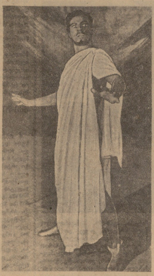
ჭაბუკიანი — ოტელი.