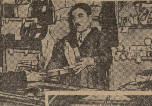
ბელა ოსათელიანი შენობები და მშენებელი...