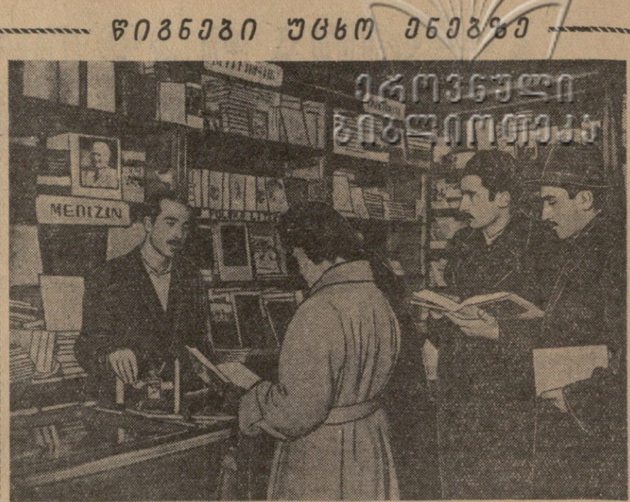
საქართველოში წლითწლით მატულობს უცხო ენების მცოდნეთა რიცხვი. ბერძენი, ინგლისური, ფრანგული, იტალიური ენების მცოდნეთა რიცხვი მატულობს.