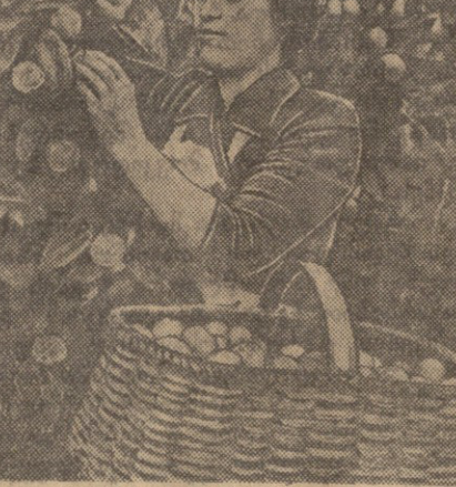
მხარბის რაიონის სოფელ შრომის ორგანიზაციის სახლობის კომპლექტის მშენებელი...