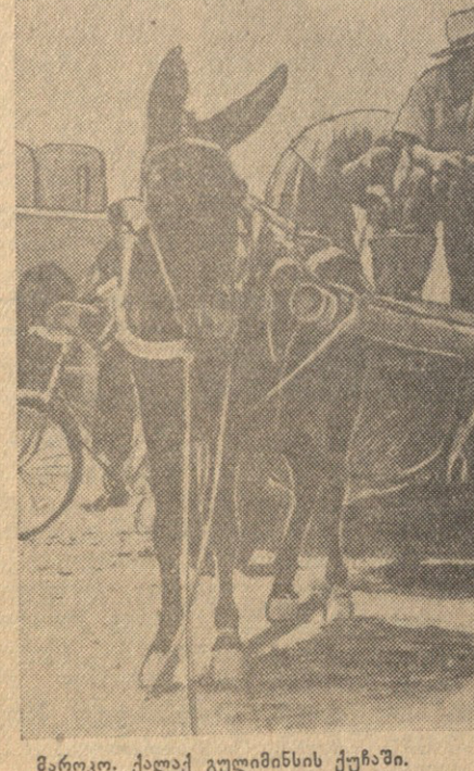
მარტო. ქალაქ გუდონის ქუჩაში.