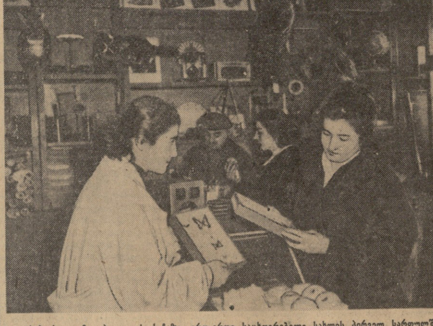
საბურთალოს, პავლიის ქუჩაზე, ერთ-ერთი სახელმწიფო სახლის პირველ სართულში რამდენიმე თვე განხორციელდა სსრ განათლების სამინისტროს სპეციალური თვალდაზრუნული დახმარებით...