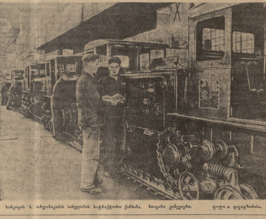
ხარკოვის ს. ორჯინიკის სახელობის სატრაქტორო ქარხანა. მთავარი კონვეიერი.

ლენინის ამ მითითების განხორციელებამ გახდა შესაძლებელი ის, რომ 1917 წლის დეკემბერში შექმნილიყო სუვერენული უკრაინის საბჭოთა სახელმწიფო.