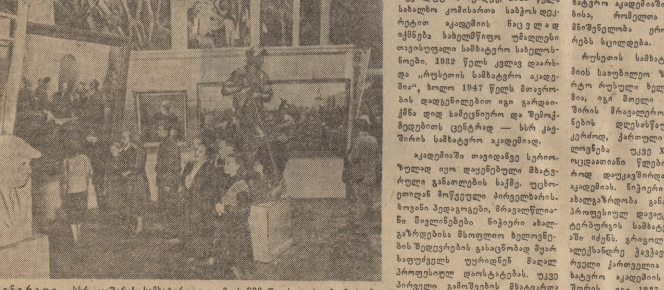
დ. ვინაია და სსრ კავშირის სამხატვრო აკადემიის 200 წლისთავისადმი მიძღვნილი გამართვის ერთ-ერთი დარსი.

პოლონეთის ბავით სსრ კავშირის უმაღლესი საბჭოს სესიის 6. ნ. ხაუროვის სიტყვა