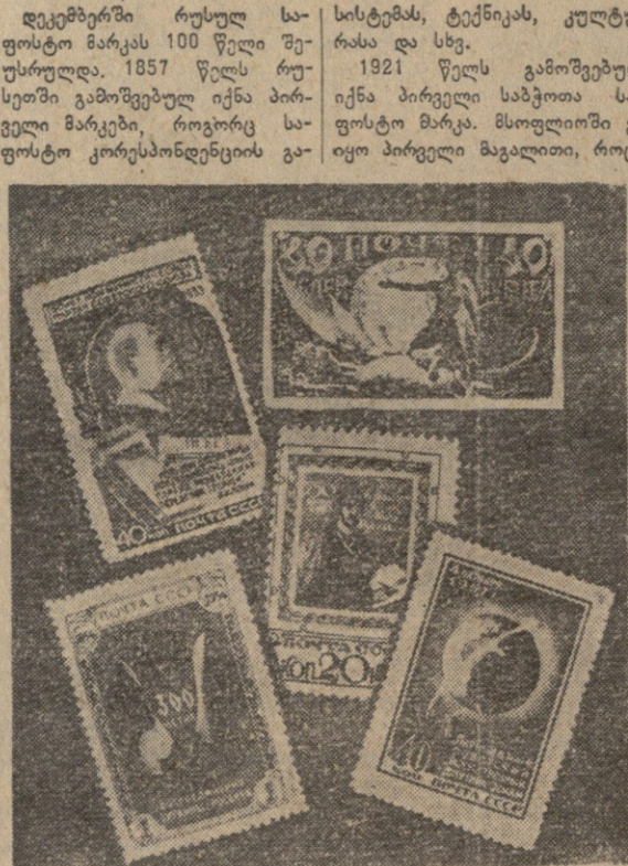
საბჭოთა მარკების ნიმუშები.

დავბავს ანაზღაურების ნიმუშს. პირველ რუსულ საბჭოთა მარკაზე გამოცემული იყო ორთავიანი არქივი, საფოსტო საბჭოთა მარკები. მანამდე ლოროვს რუსეთში, იგი სხვა ქვეყნებში საფოსტო მარკების ნაბატო სივრცეებში ითვლებოდა. მარკაზე შედგენილი იყო მარკაზე მარკების ნიმუშები. მარკაზე მარკების ნიმუშები. მარკაზე მარკების ნიმუშები.