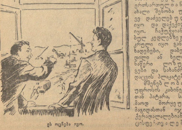
ეს იცნება იყო.