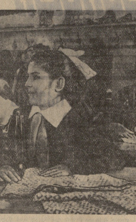
სოფელ ვაშლიანის ერთერთი... სახლის...