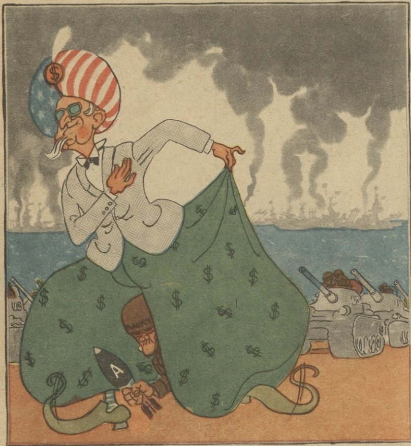
ვაშინგტონელი ალიბაბა და ას ოროცი ათასი ყარაღი