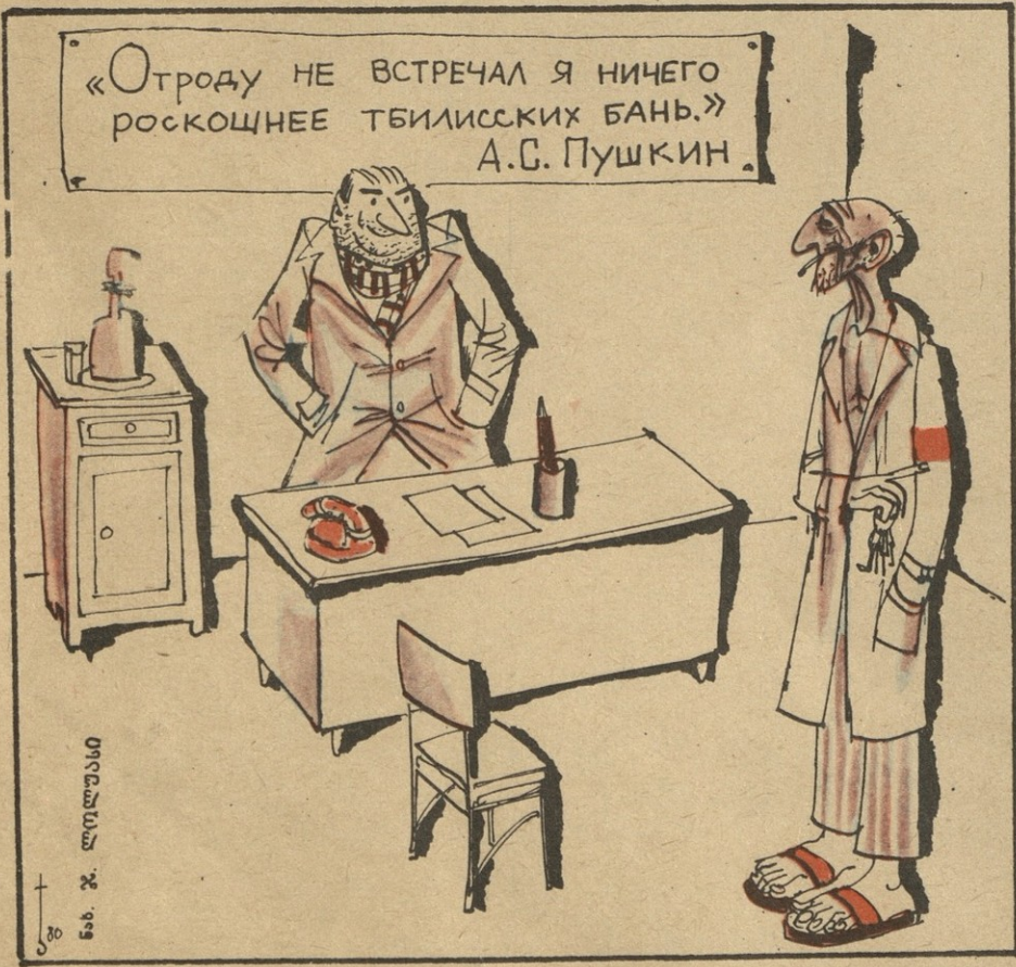
ლოლუსანი ნ. ა. ჯ.

— უფროსო! დღეს აბანოში წყალი არ მოდიოდა, მაგრამ გვგვა მიინც შევასრულეთ!