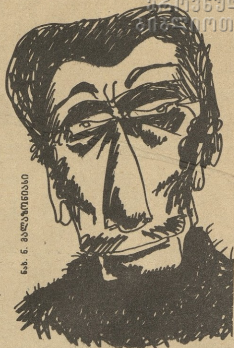
ნ. ნ. მაღალაძის ნახატი