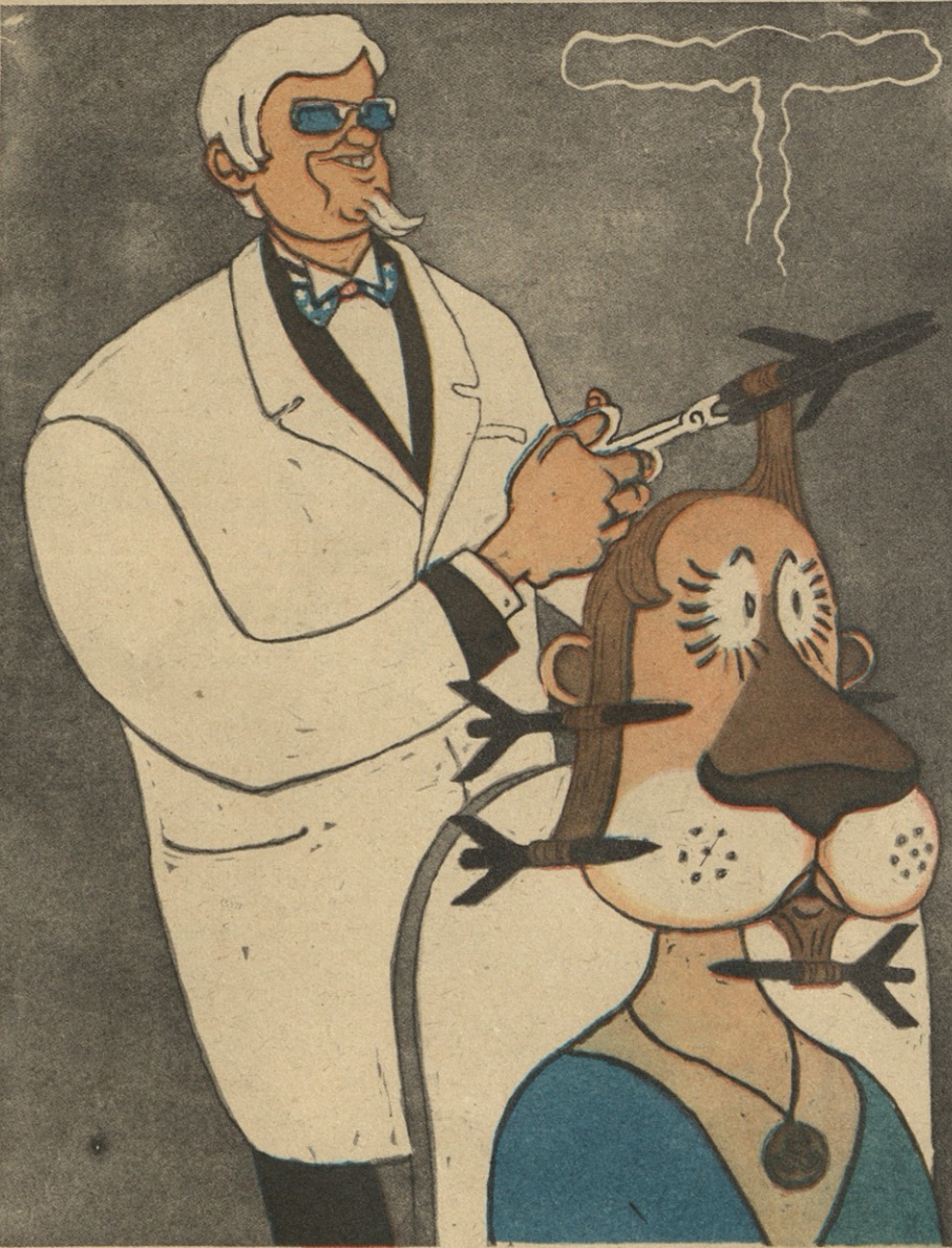
ახალი მოდის თავსმოხვევა-დახვევა