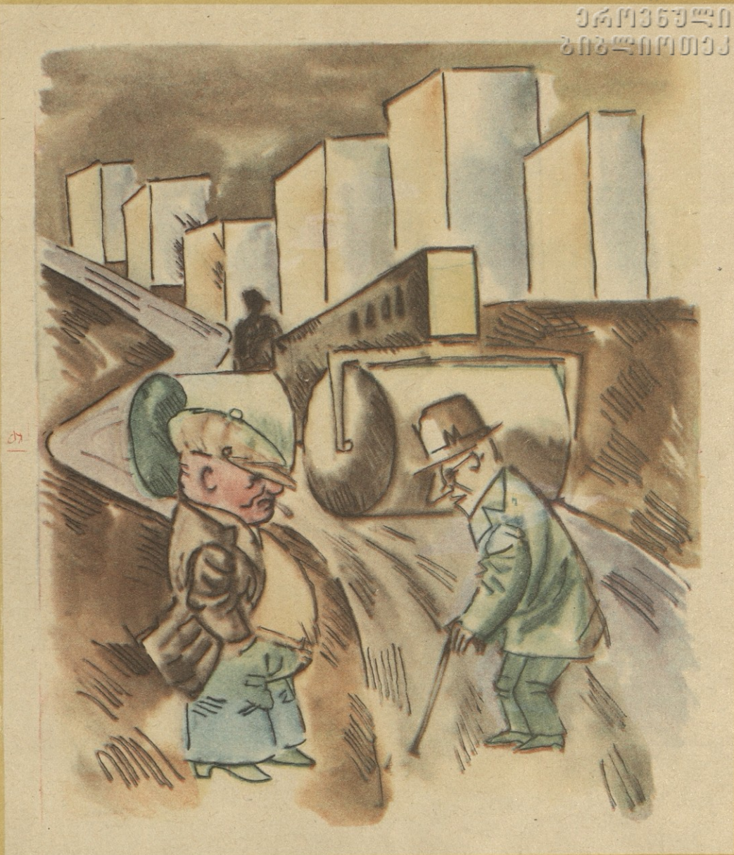
— ასე ცუდად რომ აგებთ, სომ იცი, ეს გზა სად მიგიყვანს?