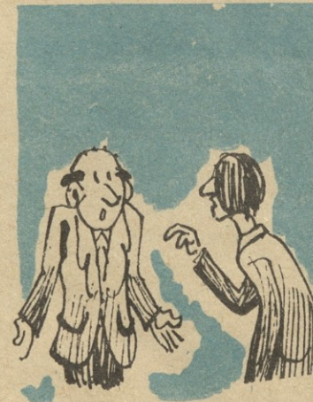
ილუსტრაციები ბ. ლომიძისა

— საქმეც ისაა, რომ არავინ არ იცის! ყველა ამუნებს, ნგრე-